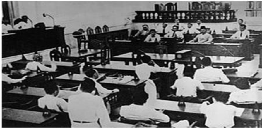
Suasana sidang kedua BPUPKI (10 Juli 1945 - 14 Juli 1945)

menggali kekayaan spiritual dan budaya bangsa yang telah terpendam dalam sejarah. Para pendiri bangsa tidak menciptakan nilai baru, melainkan merumuskan nilai-nilai yang telah ada menjadi dasar negara.