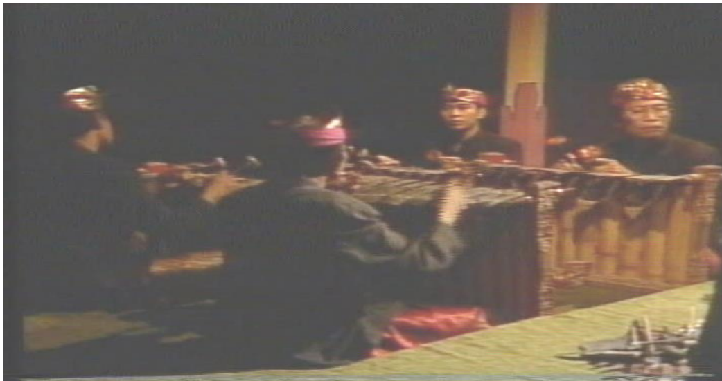
Gambar 5. 1 Tabuh Petegak Wayang Kulit Parwa Tradisional

Tabuh petegak pada umumnya tidak dipakai mengiringi adegan. Tabuh petegak ini dimainkan pada saat dalang belum naik ke atas panggung atau belum melakukan pertunjukan wayang. Tabuh petegak terdiri dari; gineman , pengawak , pengiwang , dan pengiba . Adapun aktivitas yang dilakukan oleh para dalang pada saat tabuh petegak ini adalah melakukan ritual, persiapan pertunjukan, dan menenangkan diri.