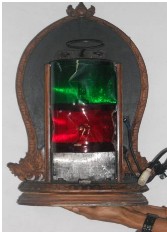
Gambar 5. 11 Lampu Belencong Wayang Cenk Blonk

Demikian halnya dalam pertunjukan wayang kulit Jawa, dimana pemakaian lampu listrik sudah mentradisi sejak lama. Bagi pertunjukan Wayang Cenk Blonk sendiri lampu listrik dipergunakan untuk menambah estetika pertunjukan, di samping tetap menggunakan lampu tradisional agar tidak menyimpang dari ajaran Dharma Pewayangan . Demikian pula halnya dengan penggunaan batang pisang dalam pertunjukan wayang kulit tradisional yang pada umumnya menggunakan satu batang sesuai panjangnya kelir , namun dalam pertunjukan Wayang Cenk Blonk hanya menggunakan beberapa lapis saja yang berfungsi untuk menutupi gabus. Selain menggunakan lampu listrik dan lampu tradisional, dalam pertunjukan kolaborasi ini juga dipergunakan obor dengan delapan sumbu. Obor ini hanya digunakan pada adegan panyacah parwa/kanda . Berikut adalah lampu blencong Listrik Wayang Cenk Blonk.