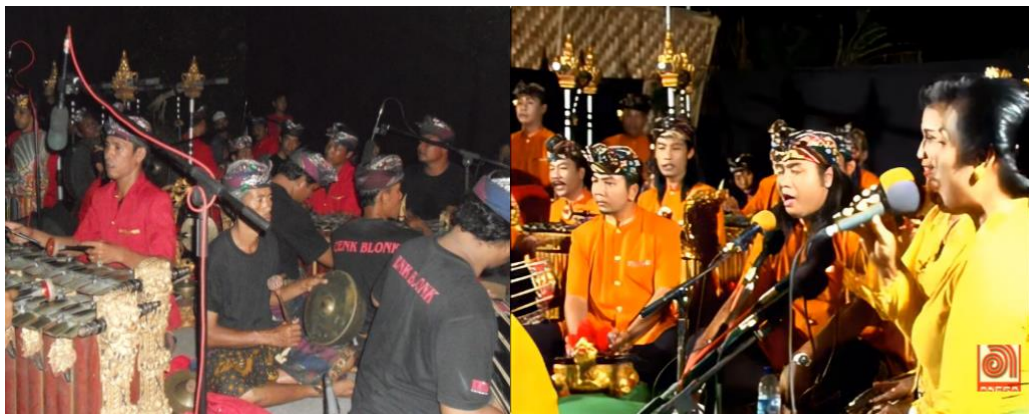
Gambar 5. 13 Penabuh dan Gerong Wayang Cenk Blonk

Untuk mengetahui tabuh iringan pertunjukan wayang kulit Cenk Blonk bergaya populer, lihatlah gambar berikut ini.