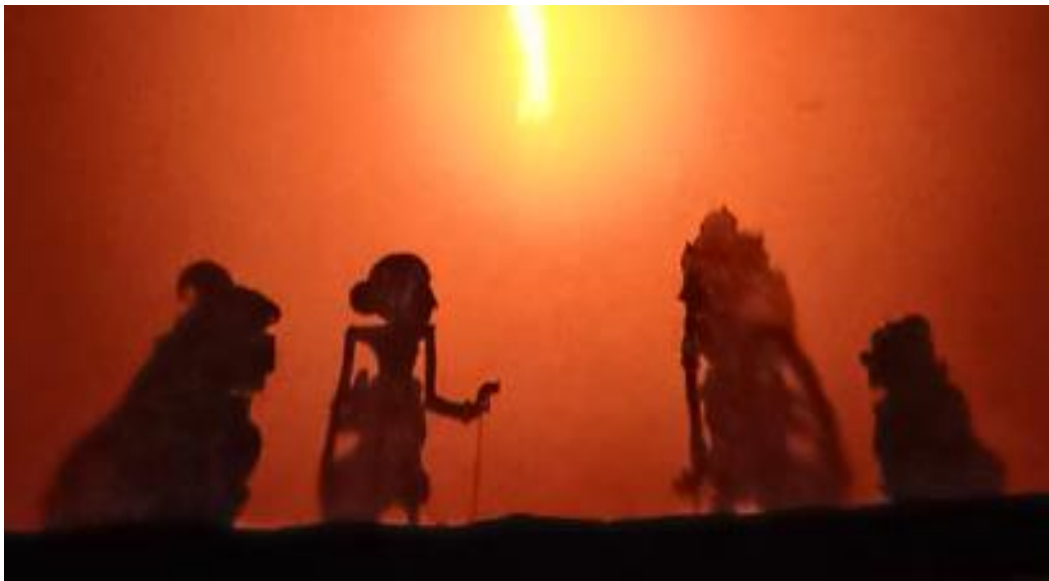
Gambar 6. 1 Tokoh Yudistira, Kresna, Tualen, dan Merdah dalam Adegan Patangkilan