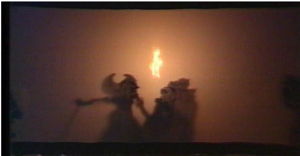
Gambar 5. 8 Adegan Bima Berperang Melawan Detya Kala Pracono Pracon (Dokumen: Marajaya)

pertunjukan lainnya yang hanya memerankan satu atau tiga tokoh seperti pada pertunjukan topeng pajegan. Perlu disadari bahwa masing-masing dalang memiliki kelemahan dan keunggulan masing-masing, maka dari itu apa yang menjadi keunggulannya, itulah yang harus lebih ditonjolkan dalam setiap pementasan. Misalnya saja kalau kita memperhatikan pertunjukan wayang kulit yang gerak wayangnya tidak fokus digarap, maka dalang-dalang yang mengikuti gayanya pun pasti melakukan hal yang sama. Tidaklah seperti yang berlaku di daerah Sukawati dan sekitarnya, dimana banyak ditemukan dalang-dalang yang sangat mumpuni di dalam menggerakkan wayang dan memainkan cepala . Kita ambil salah satu contoh yaitu dalang I Nyoman Ganjreng (almarhum). Beliau sangat mumpuni menggerakkan wayang terutama dalam adegan siat (peperangan), baik dengan tangan kosong, memakai senjata panah dan gada, termasuk menunggangi kereta, kuda, gajah, dan lain. Tetuek siat wayangnya seakan-akan benar-benar terjadi dalam dunia nyata. Mengapa demikian, karena penulis sendiri pernah melakukan kegiatan spesialisasi gerak wayang bersama mahasiswa Prodi Pedalangan pada tahun 2002 silam. Dalang lainnya yang dianggap memiliki skil menggerakkan wayang dengan apik adalah I Wayan Wija (lihat: Youtube). Berikut adalah gambar siap wayang dalam pertunjukan wayang kulit.