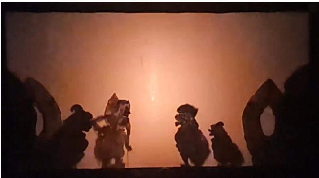
Gambar 6. 3 Prabu Gobagwesi, Raden Cupak, Tualen, dan Merdah dalam Adegan Patangkalan

Wayang Cupak jarang dipentaskan karena belum ada dalang yang menggarapnya menjadi pertunjukan inovatif. Salah satu penampilannya dapat disaksikan pada Pekan Kesenian Bali (PKB) ke-46 tahun 2024 di Art Centre Denpasar, yang ditampilkan oleh PEPADI Bali. Elemen estetika yang menonjol dalam pementasan Wayang Cupak adalah gending Cecantungan , yaitu untuk mengilustrasikan suasana Tokoh Cupak pada saat pergi ke Swarga . Berikut adalah gambar pementasan Wayang Cupak.