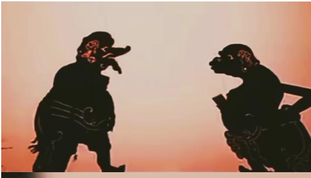
Gambar 7. 4 Tokoh Nang Klenceng dan Nang Eblong