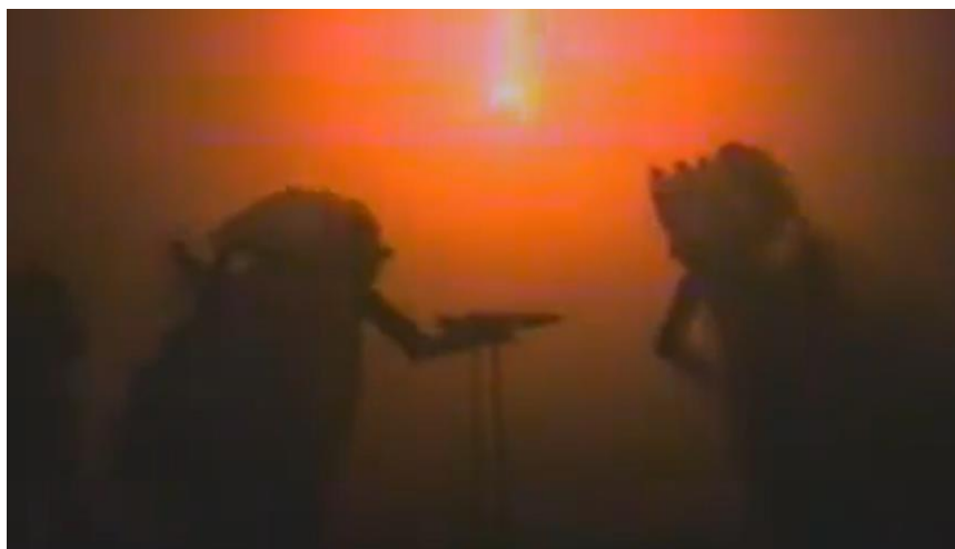
Gambar 6. 6 Adegan Raden Citakelangen Diancam dengan Keris Tri Sakti Sang Prabu.