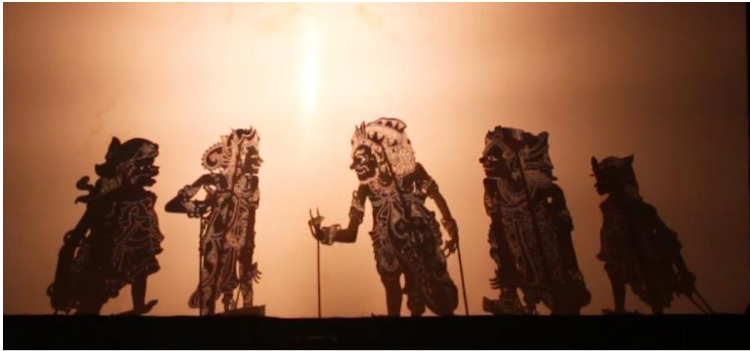
Gambar 6. 8 Adegan Patangkalan dalam Pertunjukan Wayang Babad

Ubud, Gianyar. Artistika dan estetika pertunjukan Wayang Babad hampir sama dengan jenis pertunjukan wayang kulit lainnya. Namun yang membedakan adalah tokoh-tokoh utamanya yang berbusana seperti raja Bali. Struktur pertunjukannya juga hampir sama dimulai dari tari Kayonan, adegan patangkalan , angkat-angkatan , dan pangkat siat (peperangan). Berikut ditampilkan gambar pertunjukan Wayang Babad oleh mahasiswa Prodi Seni Pedalangan Institut Seni Indonesia Bali.