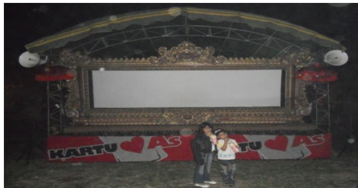
Gambar 5. 10 Kelir, Gayor, dan Panggung Wayang Kulit Inovatif

Di dalam filsafat Dharma Pewayangan , gayor dalam tubuh manusia ( bhuana alit ) melambangkan tulang belulang, sedangkan dalam alam semesta ( bhuana agung ) gayor melambangkan gunung dan bukit, serta pepohonan yang berfungsi untuk menyangga bumi agar menjadi kuat dan seimbang. Untuk mengetahui bentuk perubahan kelir , gayor , dan panggung dalam pertunjukan Wayang Cenk Blonk, lihatlah gambar berikut ini.