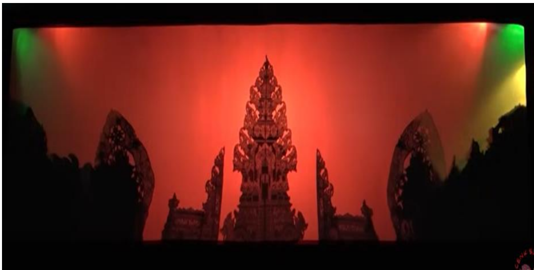
Gambar 5. 6 Suasana Adegan Panyahcah Parwa/Kanda Wayang Cenk Blonk

Berikut ditampilkan contoh visual suasana adegan dalam panyahcah parwa pada pertunjukan Wayang Cenk Blonk , yang memperlihatkan bagaimana teks naratif berpadu dengan ekspresi dramatik di atas kelir :