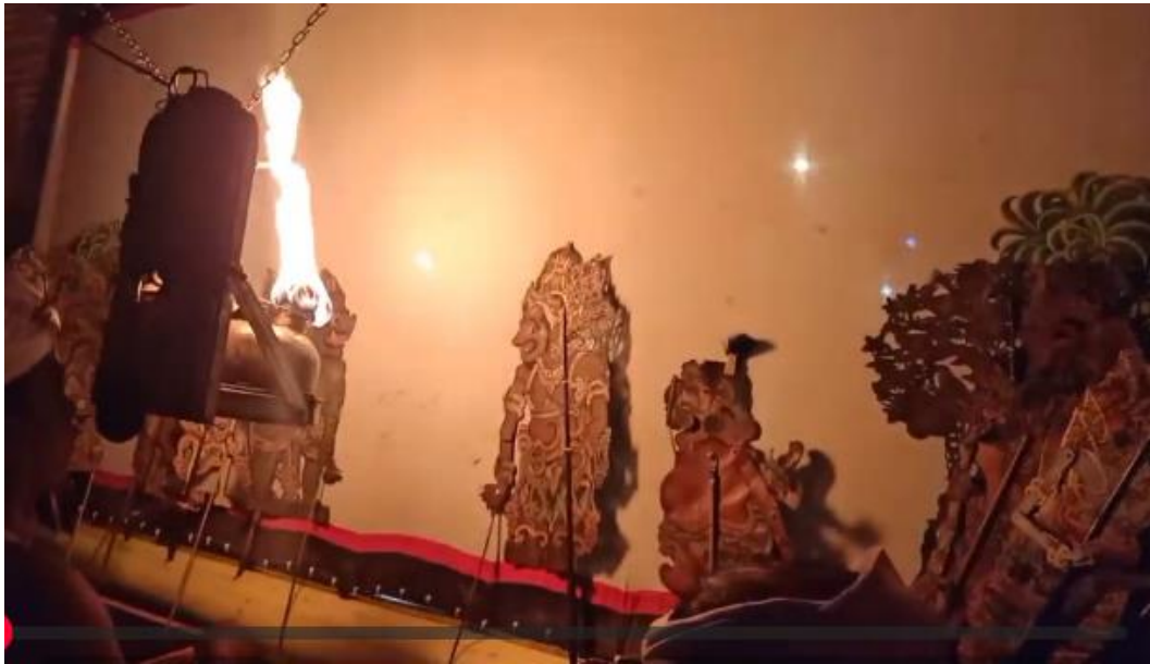
Gambar 6. 2 Rahwana, Patih Prahasta, Delem, dan Sangut dalam Adegan Patangkilan (Sumber: Youtube)

( ngore ) sebagai bala tentara Sang Rama. Oleh karena itu, biasanya hanya laki-laki yang berminat menjadi dalang Wayang Ramayana. Pertumbuhannya pun tidak sepesat Wayang Parwa, yang selalu dijadikan dasar pembelajaran mendalang baik di masyarakat maupun di lembaga pendidikan seni. Berikut adalah gambar pertunjukan Wayang Ramayana oleh Jero Dalang Tunjung dari Desa Pengosekan, Kecamatan Ubud, Kabupaten Gianyar.