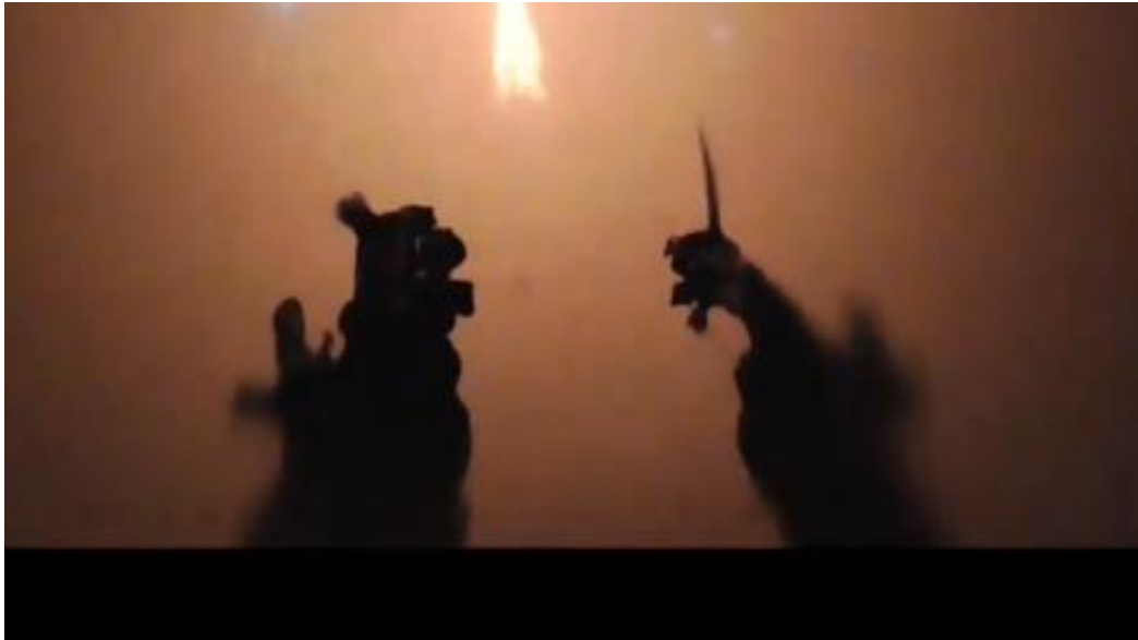
Gambar 5. 7 Adegan Delem dan Sangut dalam Pertunjukan Wayang Kulit