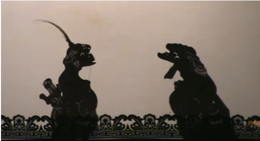
Gambar 7. 2 Tokoh Bebondresan Joblar dan Sangut Gaya Badung

Wayang Parwa di Bali. Berikut ditampilkan gambar pengembangan pertunjukan wayang kulit Gaya Badung melalui tokoh bebondresan bernama Joblar oleh dalang I Ketut Muada.