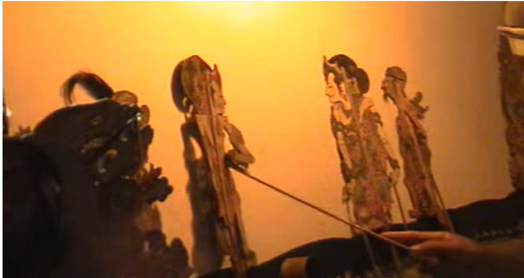
Gambar 6. 7 Adegan Patangkilan dalam Pertunjukan Wayang Tantri