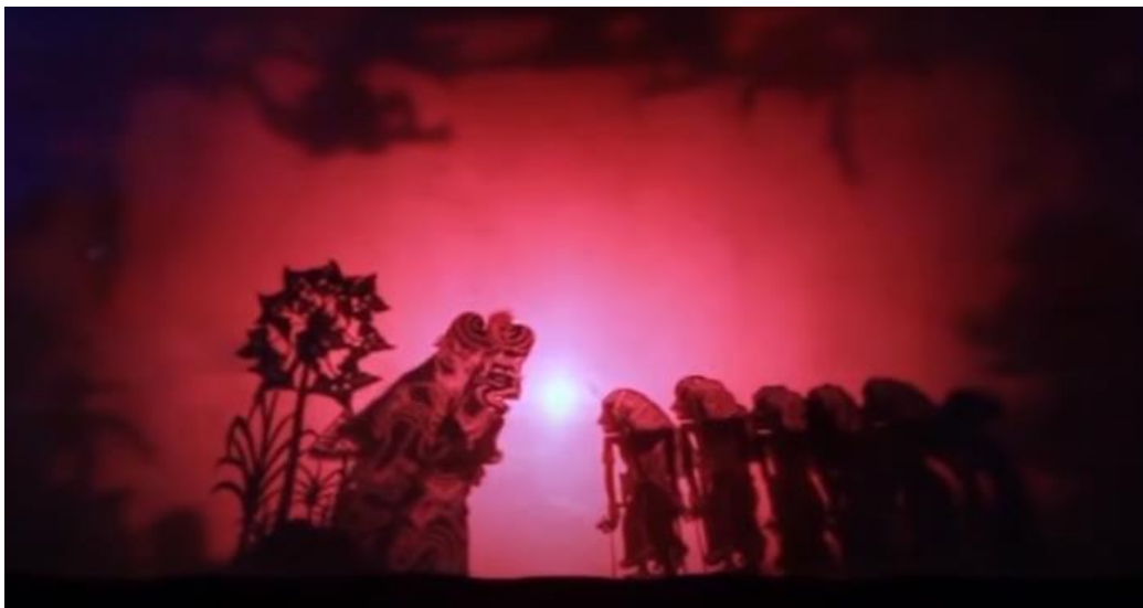
Gambar 6. 4 Tokoh Ratu Gede Mecaling dan Murid-muridnya dalam Adegan Ngerih

Wayang Calonarang umumnya dipentaskan di atas kuburan untuk menguji adrenalin penonton. Pementasan ini tidak dilakukan oleh perorangan sebagaimana pada upacara manusa yadnya , dewa yadnya , pitra yadnya , rsi yadnya , maupun bhuta yadnya , melainkan oleh kelompok masyarakat seperti; Sekaa Pura , Banjar Adat, Desa Adat, Yayasan Kebatinan, dan sebagainya. Fungsinya adalah untuk nyomia bhuta kala (mengembalikan mereka ke alamnya), atau yang sering disebut sebagai penolak bala. Pertunjukan ini biasanya diiringi berbagai jenis gamelan, antara lain Batel Sulendro , Semar Pagulingan , Pelegongan , Angklung Kebyar , dan Gong Kebyar . Berikut adalah gambar pementasan Wayang Penyalonangan oleh dalang I Putu Gede Sartika (Wayang Calonarang Dug Byor).