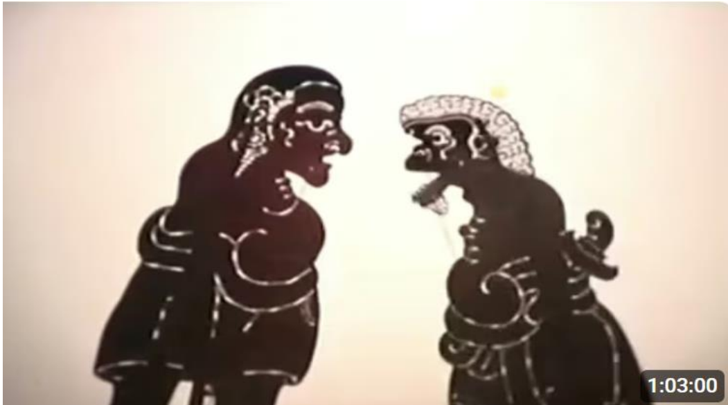
Gambar 7. 5 Tokoh Bebondresan Wayang Kulit Gaya Buleleng

pertunjukan wayang kulit gaya Buleleng oleh dalang I Wayan Sudarma.