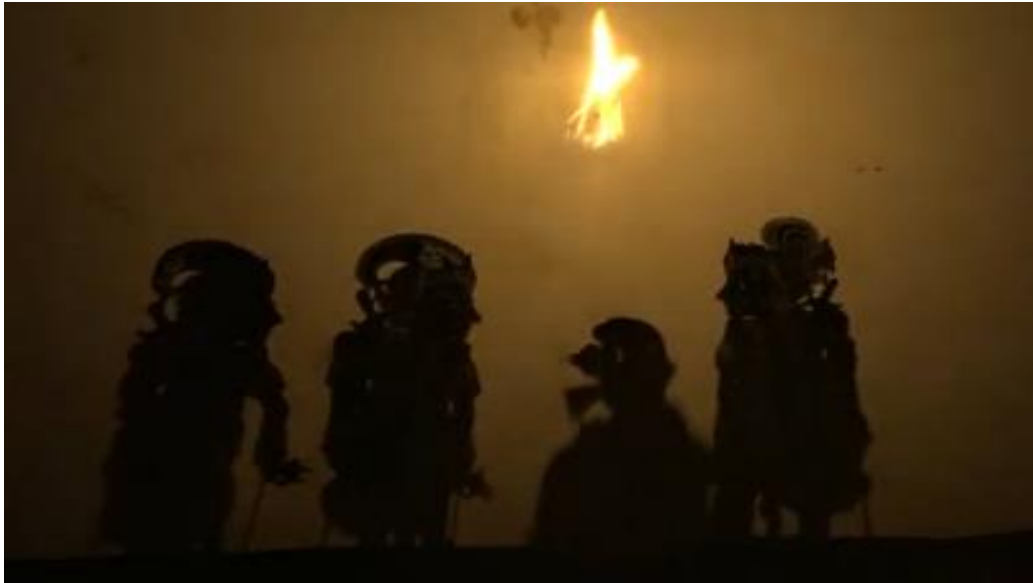
Gambar 6. 5 Adegan Patangkilan dalam Pertunjukan Wayang Gambuh

antawacana menyesuaikan gaya dramatari Gambuh; (4) tetandakan/sesendon mengikuti irama gamelan Gambuh; dan (5) lakon yang dibawakan sama dengan dramatari Gambuh, yakni bersumber dari cerita Malat. Berikut adalah gambar pementasan Wayang Gambuh oleh dalang I Ketut Wirtawan.