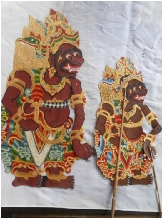
Gambar 5. 12 Tokoh Kumbakarna Diperbesar 40 %

Dari gambar tersebut di atas dapat dijelaskan bahwa, wayang-wayang yang dipakai dalam pertunjukan inovatif khususnya wayang kulit Cenk Blonk saat ini adalah wayang-wayang yang telah mengalami dekonstruksi yaitu perubahan ukuran hingga mencapai 40 % (gambar kiri) dari tokoh wayang Kumbakarna tradisi (kiri).