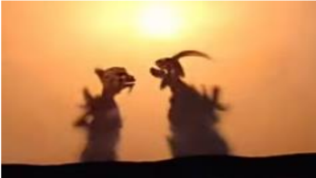
Gambar 7. 1 Tokoh Bebondresan pada Wayang Kulit Gaya Sukawati

bagi daerah yang belum memiliki gaya pedalangan lebih terbuka untuk menerimanya seperti; Kabupaten Jembrana, Kabupaten Klungkung, Kabupaten Karangasem, dan Kota Denpasar. Berikut adalah gambar pertunjukan wayang kulit gaya Sukawati. Berikut adalah gambar pertunjukan wayang kulit Gaya Pedalangan Sukawati.