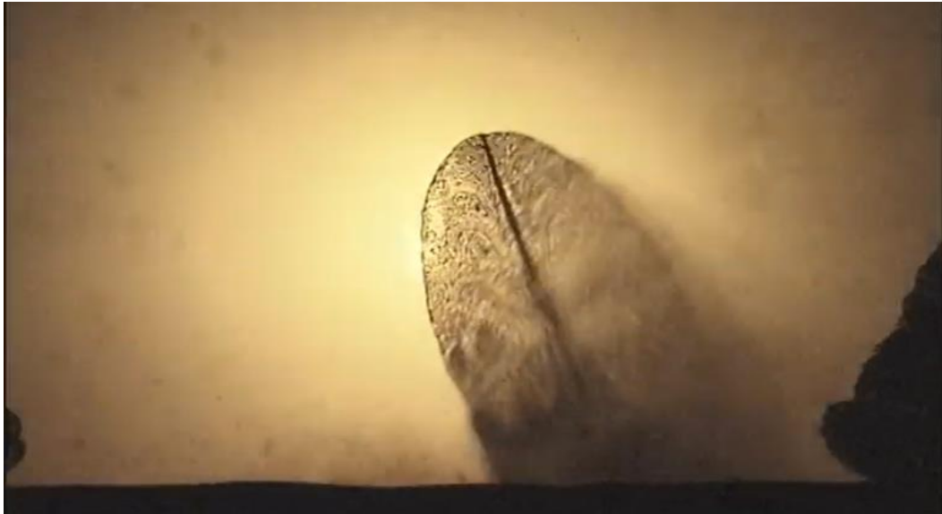
Gambar 5. 4 Komposisi Tari Kayonan Pada Nyanyian Alas Harum