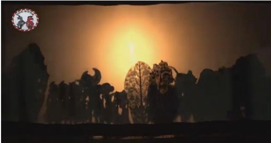
Gambar 5. 3 Adegan Paguneman dalam Pertunjukan Wayang Cenk Blonk