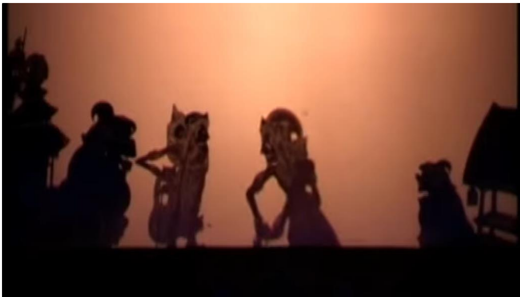
Gambar 5. 5 Adegan Patangkilan dalam Pertunjukan Wayang Kulit Bali

Apabila tokoh utama hanya satu, cukup empat baris saja yang dinyanyikan dalam satu bait, atau sesuai siasat dalang dalam menampilkan tokoh-tokohnya. Musik iringan pun mengikuti tahapan yang dimainkan dalang, sehingga tidak ada bagian vokal yang mendominasi musik, maupun sebaliknya. Dalam penyajian, vokal dan musik berjalan bersamaan tanpa saling menunggu. Durasi dan frekuensi keduanya harus disesuaikan, agar tidak terjadi ketidakseimbangan, misalnya musik telah selesai sementara syair masih dilantunkan. Jika hal itu terjadi, nuansa estetik adagen alas-harum akan kehilangan daya tarik audio-visualnya.