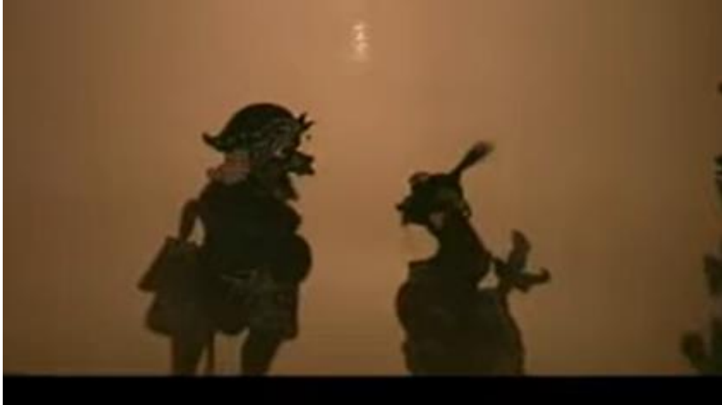
Gambar 7. 3 Tokoh Bebondresan dan Punakawan Sangut Wayang Bangli

lain sebagainya. Berikut adalah gambar pertunjukan wayang kulit gaya Bangli yang menampilkan tokoh punakawan dan bebondresan .