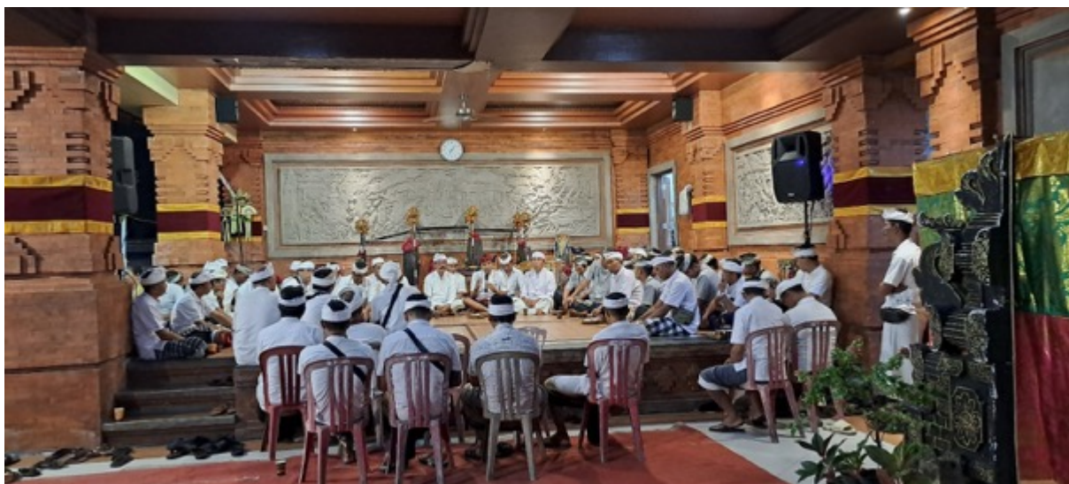
Pertemuan Adat, Pebrayan Banjar Kwanji Kaja, Sempidi