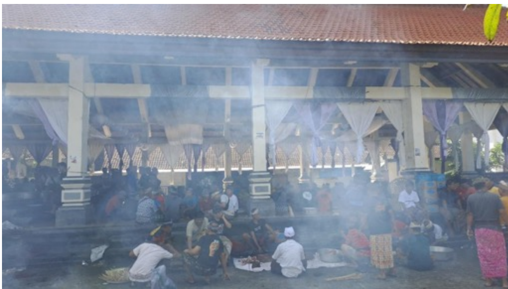
Gambar 11. Kegiatan Mebat di Banjar , Timrah, Karangasem Sumber: Dokumentasi I Nyoman Mariyana, Tahun 2023