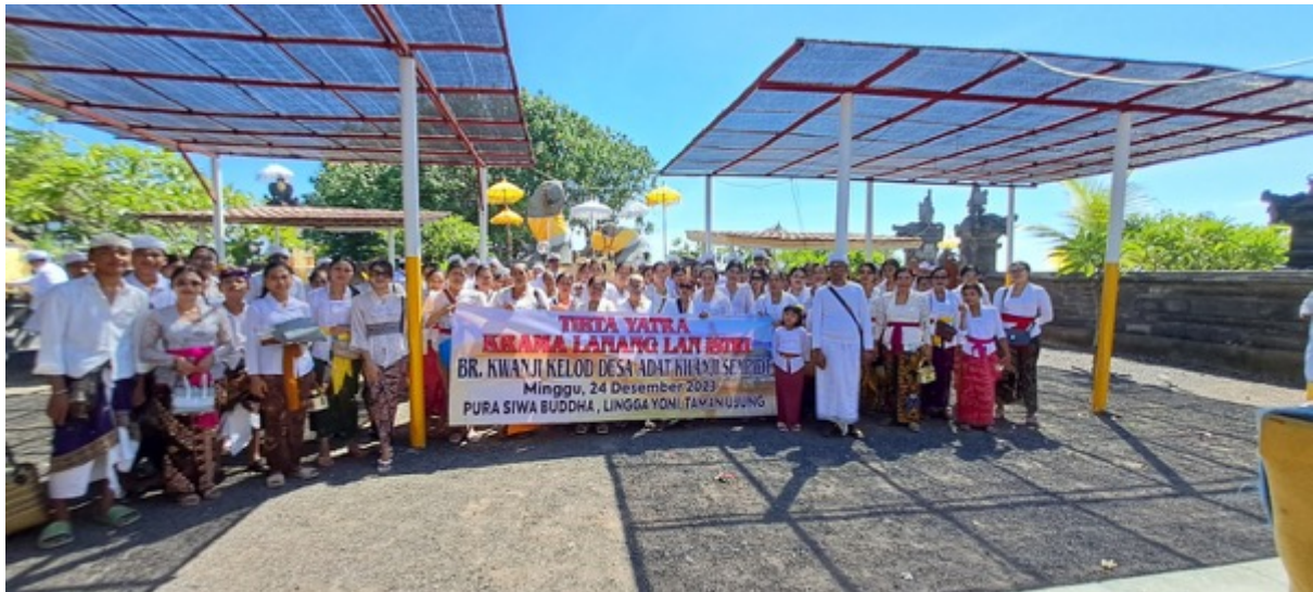
Tirta Yatra Banjar Kwanji Kelod Sempidi