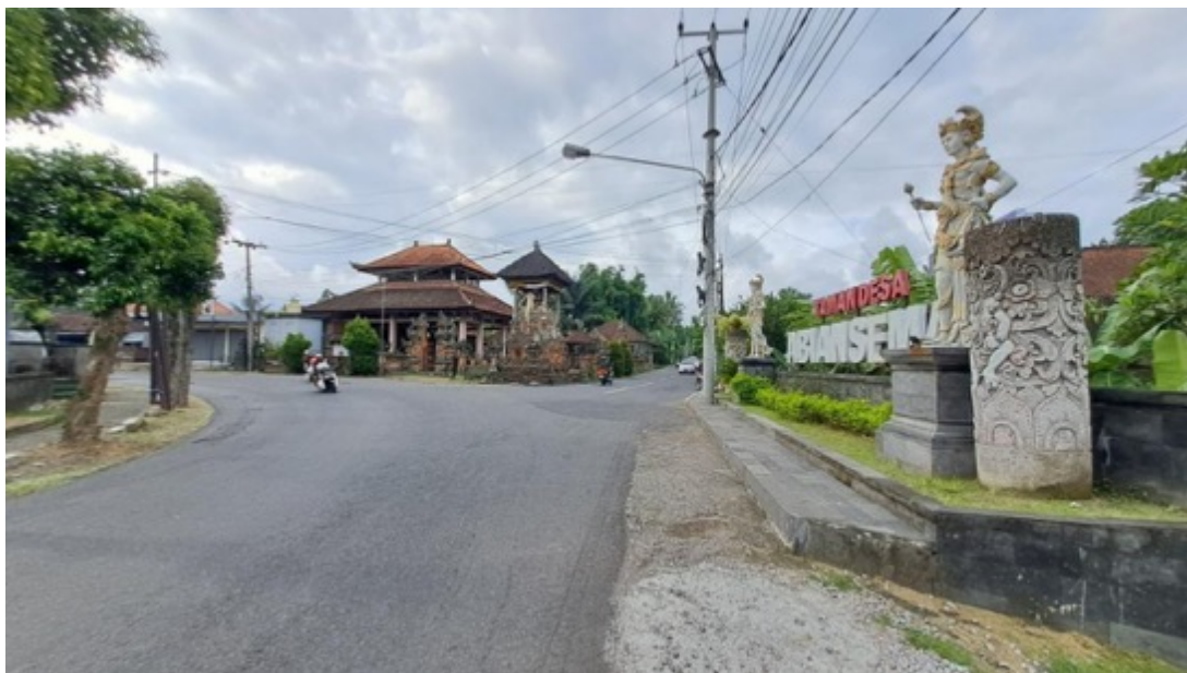
Gambar 5. Posisi Banjar Pande Abiansema Badung

Bangunan Bale Banjar memiliki desain yang khas arsitektural Bali dengan berbagai bentuk ragam hias di dalamnya. Adapun struktur bangunan bale banjar terdiri dari: