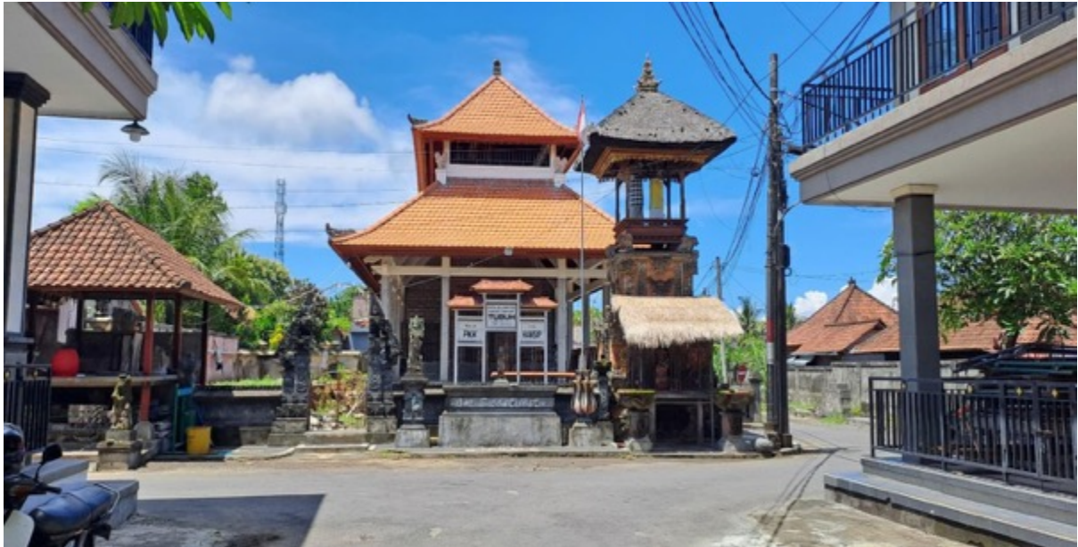
Gambar 4. Banjar Tubuh, Blahbatuh, Kabupaten Gianyar