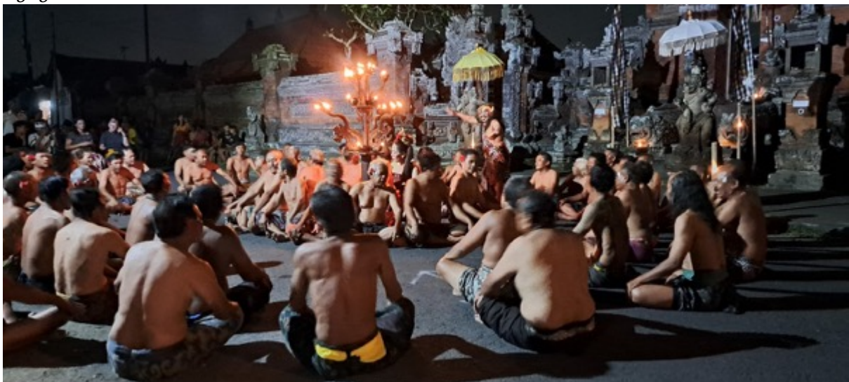
Sekaa Kecak dari Krama Banjar di Desa Bona