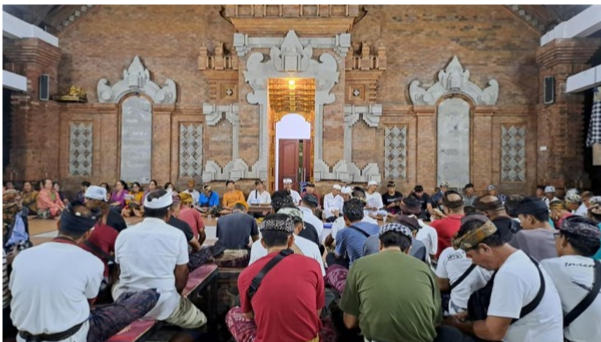
Gambar 12. Kegiatan Sangkep di Desa Adat Kwnaji Sempidi

Dalam proses berforum tersebut ada alat yang dinamakan Janggi . Janggi sebuah media pengukuran waktu yang digunakan saat rapat mengukur waktu kehadiran krama banjar . Janggi diisi air, yang kemudian dilubangi pada sisi bawah, lalu airnya dialiri sedikit. Ini digunakan untuk mengukur waktu bagi krama yang terlambat saat parum digelar. Di masa sekarang, Janggi seperti timer atau alat pengingat waktu. Kalau di luar negeri banyak kita temukan jam pasir sebagai timer atau alat pengingat waktu kuno, masyarakat Bali justru menggunakan air. Janggi dan air dipadukan sehingga berfungsi sama dengan timer .