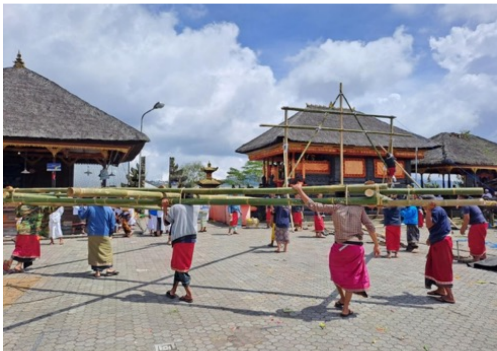
Gambar 7. Kegiatan Ngayah Krama Lanang Di Pura Batur

Akan tetapi beberapa orang Bali sering menganggap bahwa ngayah adalah sebuah kegiatan yang menyebabkan seseorang stressfull, karena mengabiskan banyak waktu, tenaga, pikiran tanpa adanya imbalan tertentu. Ada sebuah penelitian klinis dari organisasi pada rumah sakit jiwa menunjukkan bahwa 75 % dari orang yang rutin melakukan kegiatan ngayah mengalami penurunan tingkat stress dan kecemasan.