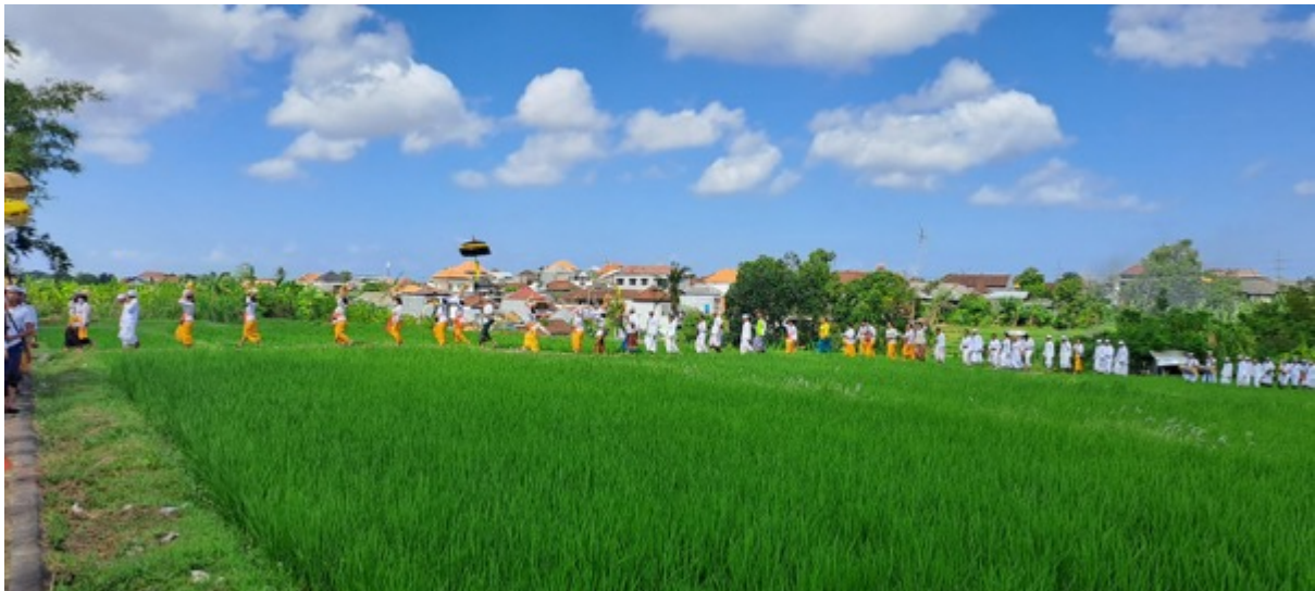
Gambar 8. Prosesi Ngebejiang Pada Piodalan di Pura Khayangan Tiga Desa Adat Kwanji Sempidi, Badung

Pada pelaksanaan upacara di piodalan di Pura Khayangan Tiga , biasanya dimulai dari prosesi ngebejiang (prosesi membawa semua jenis tapakan/pretima menuju sumber air untuk mesucian ).