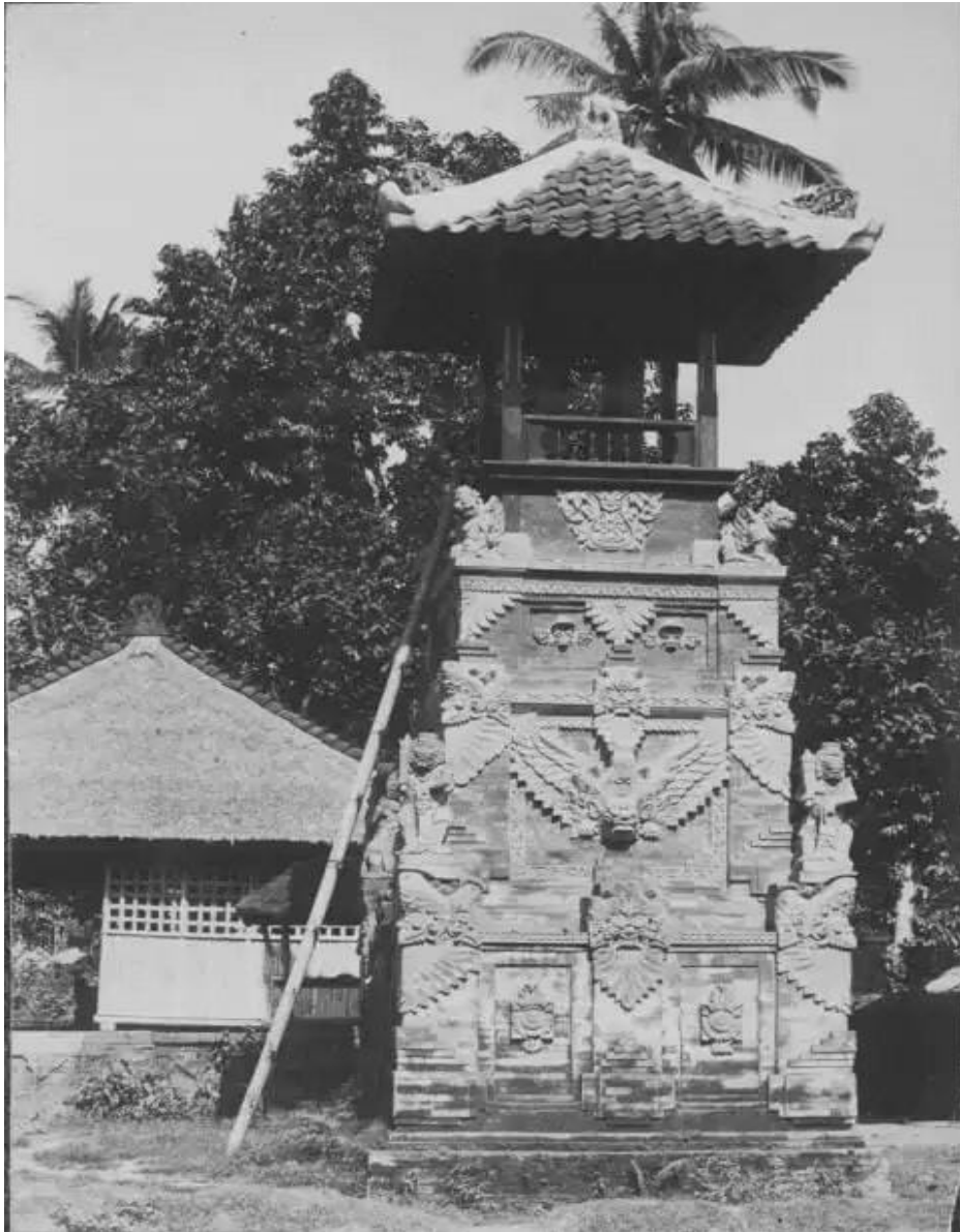
Gambar 3. Bentuk Bangunan Bale Kulkul Pada Salah Satu Banjar Di Daerah Sesetan

Bale banjar merupakan wadah atau wujud fisik pemerintahan pada unit terkecil yang sangat demokratis. Wadah atau wujud tersebut umumnya berupa wantilan. Bale Banjar selain sebagai tempat berkumpul “ sangkep ” juga untuk pementasan kesenian, sabungan ayam dan segala aktivitas yang dibutuhkan masyarakat. Wujud Bale Banjar berkembang atas tuntutan pelaku dan kegiatannya sesuai dengan persetujuan warganya. Bale Banjar mengadopsi konsep wantilan dengan fungsi bangunan serba guna sebagai ruang “Publik” dengan berbagai aktivitasnya.