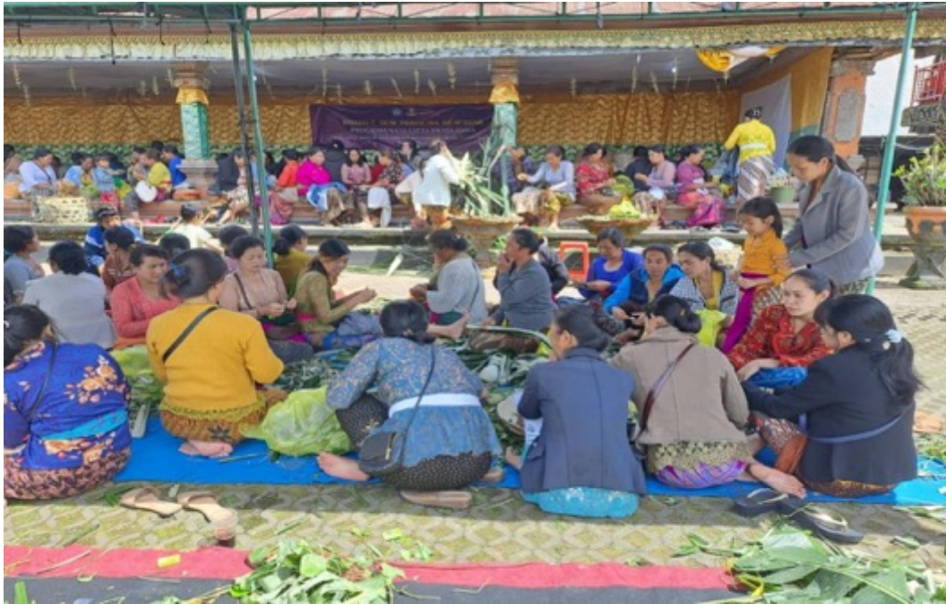
Gambar 6. Kegiatan Ngayah Krama Istri di Pura Batur

Akan tetapi beberapa orang Bali sering menganggap bahwa ngayah adalah sebuah kegiatan yang menyebabkan seseorang stressfull, karena mengabiskan banyak waktu, tenaga, pikiran tanpa adanya imbalan tertentu. Ada sebuah penelitian klinis dari organisasi pada rumah sakit jiwa menunjukkan bahwa 75 % dari orang yang rutin melakukan kegiatan ngayah mengalami penurunan tingkat stress dan kecemasan.