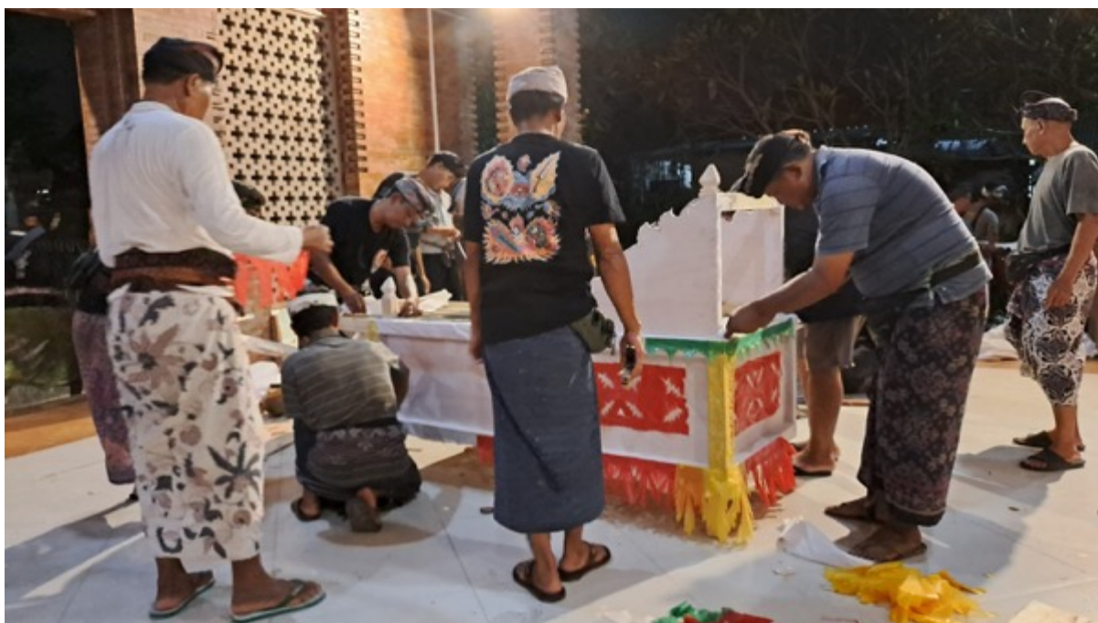
Gambar 15. Proses Pembuatan Wadah Oleh Krama Banjar Kwanji Kelod, Sempidi, Badung

Dalam pelaksanaan pengabenan, klian banjar akan membagi tugas krama banjar untuk mengambil pekerjaan mulai dari persiapan sarana ( upakara banten pengabenan ) hingga pembakaran mayat. Semua pekerjaan tersebut dibagi tugasnya kepada krama dan krama bertanggung jawab terhadap tugas yang diberikan hingga pekerjaan tersebut tuntas dilaksanakan.