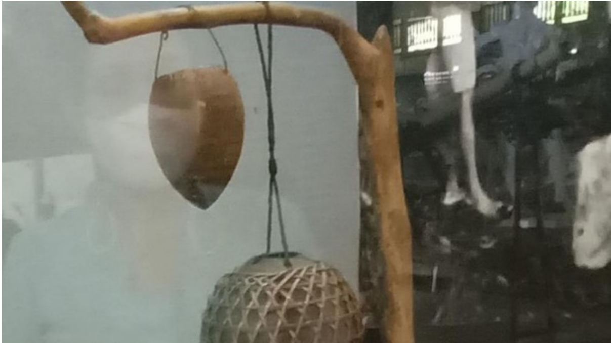
Gambar 13. Janggi , Salah Satu Koleksi Museum Subak .

Janggi ini kini tak lagi digunakan. Para peserta rapat subak umumnya telah menggunakan jam tangan maupun handphone sebagai timer . Namun sisa kejayaan Janggi masih bisa dilihat di Museum Subak , Tabanan. Museum ini masih menyimpan koleksi janggi dengan rapi (detik Bali, diakses 8 April 2024).