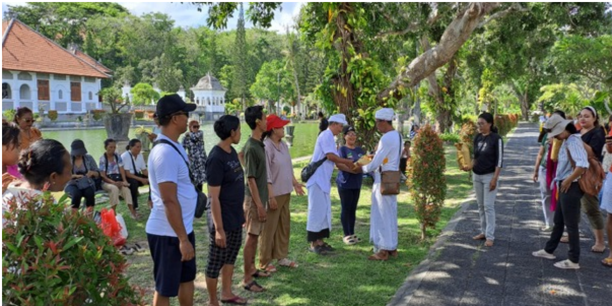
Gambar 16. Kegiatan Liburan Krama Banjar Kwanji Kelod, Sempidi, Badung

Penting kiranya dalam menjalin kekerabatan antar krama banjar melakukan liburan bersama segenap krama banjar . Kegiatan ini selain untuk melepas penat dengan hiruk pikuk kegiatan bebanjaran , juga dapat merekatkan tali persaudaraan antar krama . Kegiatan ini dapat diisi dengan perlombaan dan hiburan yang tentunya akan mengundang canda tawa bagi semua peserta. Dengan liburan ini juga dapat meningkatkan komunikasi yang aktif sehingga berdampak baik bagi psikologis masyarakat.