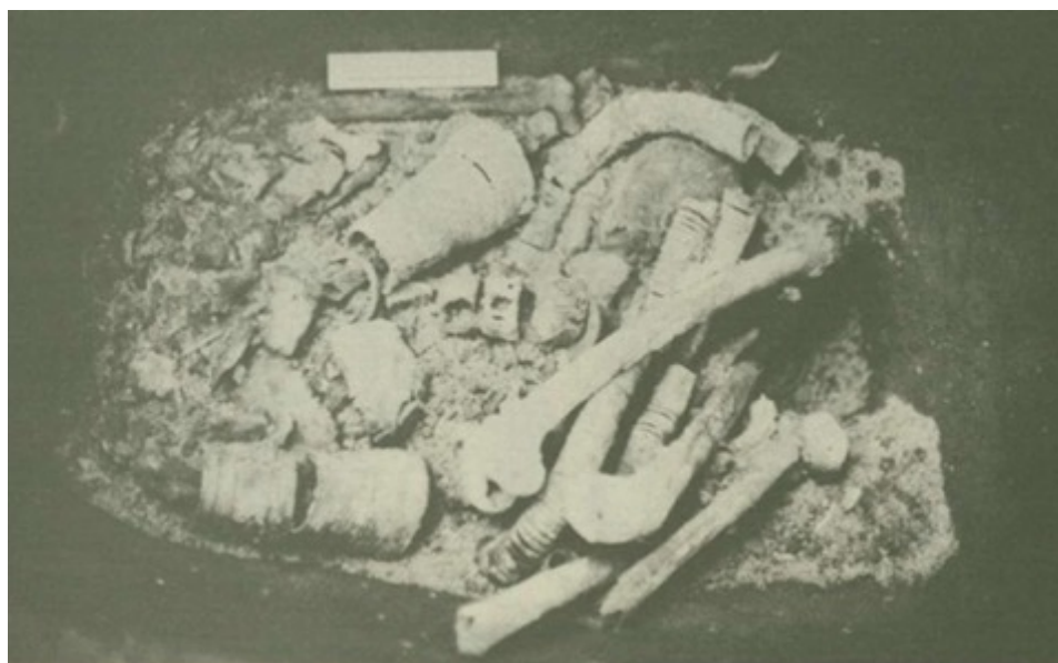
Gambar 1. Ekskavasi sarkofagus Marga Tengah (lok. 23).

Jejak kehidupan masa lampau di Gilimanuk dibuktikan dengan peninggalan berupa sisa-sisa kehidupan permukiman (necropolis). Dalam ekskavasi-eks kavasi yang dilaksanakan di Gilimanuk peninggalan-peninggalan tersebut didapati di lapisan 3 (lapisan budaya) dan di lapisan 4 (lapisan kubur). Sarkopagus sebagai artefak hasil karya manusia yang telah berbudaya, sebagai simbol status dalam upacara penguburan. Hal itu mengindikasikan bahwa, telah ada sistem pembuatan artefak berdasarkan kemajuan teknologi yang dilakukan secara bersama (komunal). Bahan-bahan yang diperoleh dari adat penguburan sarkofagus di pedalaman dan di permukiman-nekropolis di Gilimanuk memberi petunjuk tentang beberapa aspek kehidupan pada jaman perundagian di Bali. Pada zaman ini terdapatlah di pedalaman golongan-golongan masyarakat yang terdiri dari para undagi (tukang) yang mengkhususkan diri dalam bermacam-macam spesialisasi antar lain: tukang batu, tukang gerabah, pande logam, serta golongan pengatur upacara religius. Di Gilimanuk juga hidup secara berkelompok para nelayan yang mengadakan hubungan ekonomis dengan daerah pedalaman dan daerah-daerah di luar Bali.