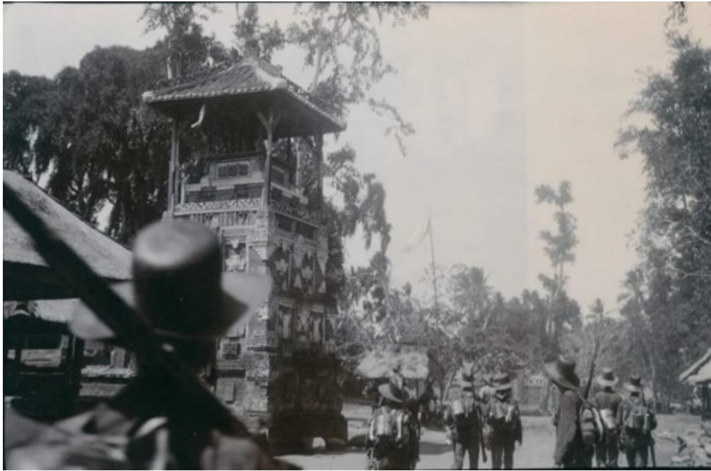
Gambar 2. Banjar Kedaton Kesiman Tahun 1906