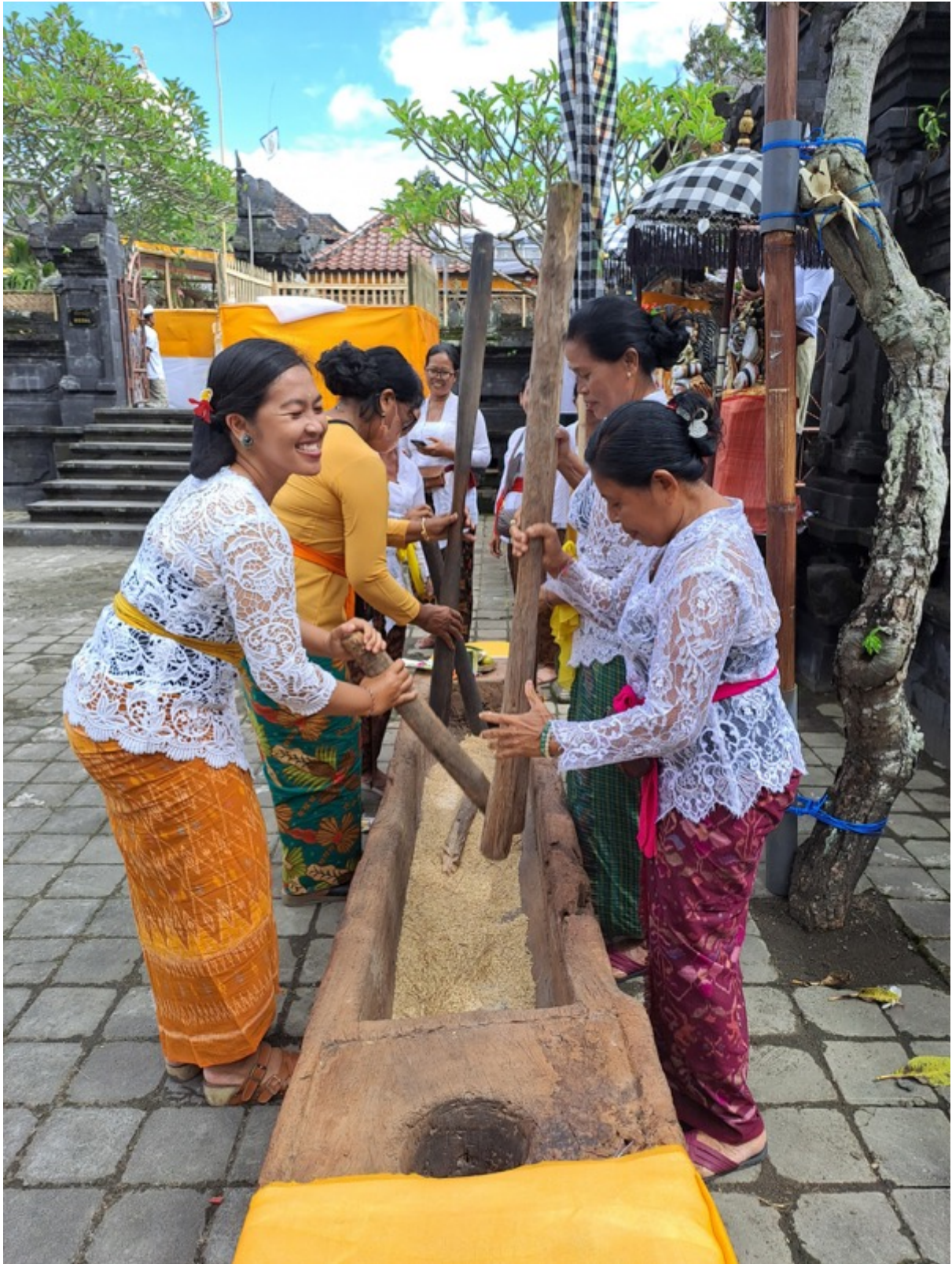
Ngayah Krama Bajar Istri di Desa Adat Kwanji Sempidi