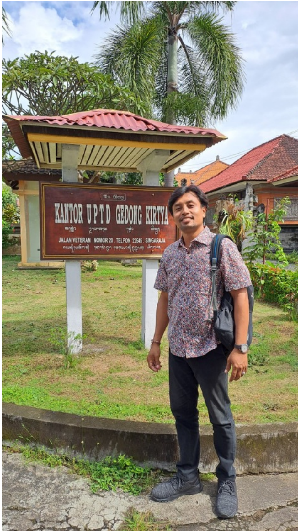
Pencarian Sumber tertulis di Gedong Kertya, Singaraja