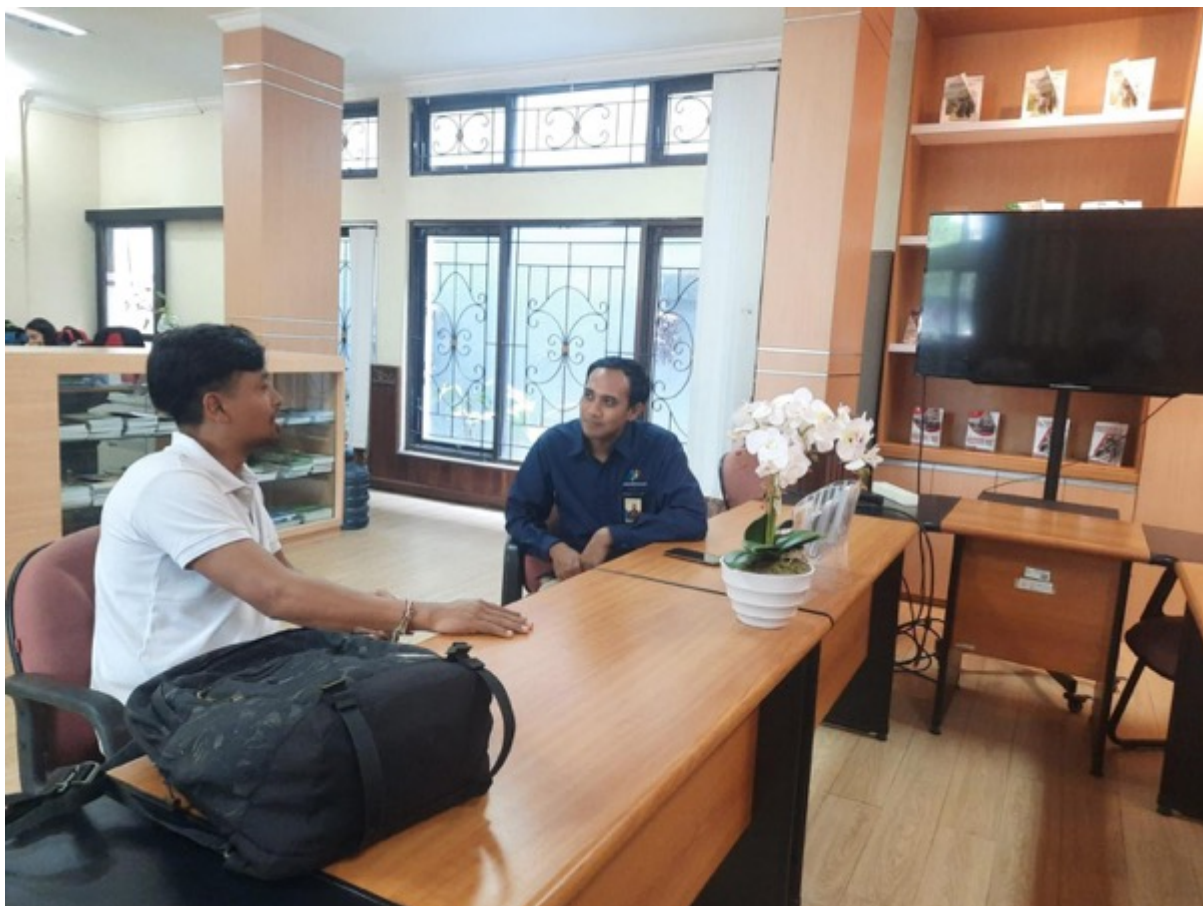
Wawancara terkait data Banjar di Pusat Statistik Provinsi Bali