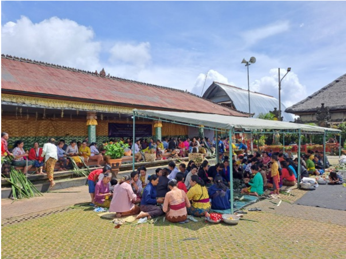
Ngayah Krama Istri di Desa Batur