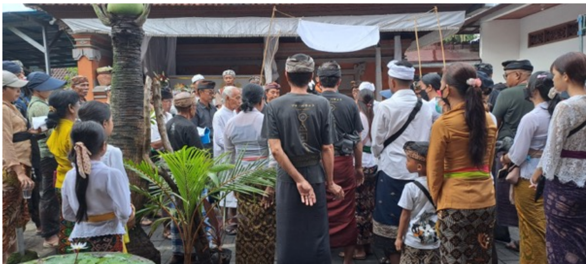
Gambar 14. Krama Banjar Melakukan Prosesi Pemandian Jenasah saat Ngaben

Berkaitan dengan upacara kematian atau ngaben , apabila ada salah satu anggota keluarga dari krama banjar meninggal, biasanya semua pekerjaan akan diambil alih oleh banjar berdasarkan kesepatan keluarga duka, banjar , dan prejuru desa adat ( Bendesa ). Apabila disetujui, maka kegiatan ngaben akan sepenuhnya digarap oleh krama banjar yang dikoordinir oleh klian banjar . Biasanya, dalam tata cara pengabenan yang berlaku di dalam lingkup banjar mengacu pada keputusan, dresta , yang termuat pada awig-awig desa adat setempat. Krama Banjar hingga krama desa (sesuai daerah masing-masing), biasanya memberikan santunan kepada krama / keluarga yang meninggal berupa uang yang disebut dengan istilah patis atau patus yang besarnya tergantung kesepakatan dalam awig-awig banjar/desa . Tingkat pengabenan dalam ajaran agama Hindu dapat dikelompokkan menjadi tiga yakni; Nistaning utama , madyaning utama dan utamaning utama .