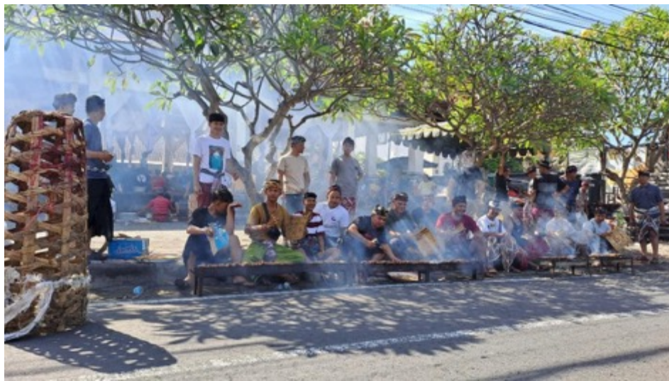
Gambar 10. Tradisi Mebat di Timrah, Karangasem

Dalam kehidupan mebanjar terjadi interaksi beberapa individu. Ketika terjadi kegiatan mebat di banjar , ada beberapa tahap kegiatan yang dilalui yakni; Ngatik , Ngebasa , Nyate dan Ngelawar . Dalam proses ngatik , membuat katik sate kadang kita ketemu dengan satu dua orang atau lebih. Dalam kegiatan itu, sambil bekerja terjadi diskusi atau obrolan yang dapat memberikan berbagai hal menarik dan terjadi komunikasi antar kelompok.