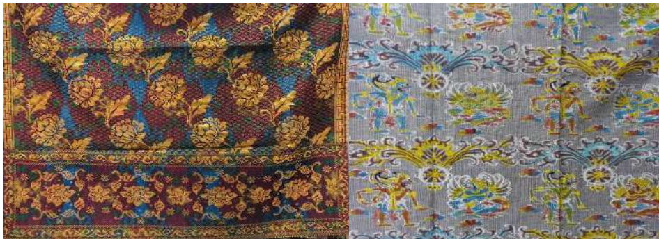
Gambar 61: Kain Arnis Motif Bunga Pucuk dan Papatran Karya Pertenunan Putri Ayu