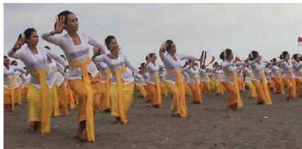
Gambar 8: Kegunaan Kain Tenun Sebagai Kamben Tari Rejang Renteng

Dalam usaha untuk membuat seragam dengan penampilan yang menarik dan elegan, kain tenun menjadi pilihan utama bagi