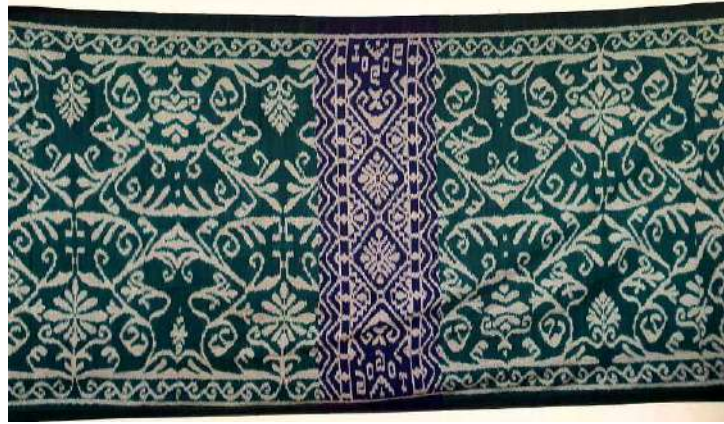
Gambar 12: Kain Tenun Yang Memadukan Motif Geometris Wajik Dengan Motif Bunbunan, Cap Togog

Memadukan dua motif hiasan pada satu bidang dengan motif dan komposisi garis yang berbeda adalah inovasi unggulan pertenunan cap Togog. Motif wajik berwarna biru dibuat secara vertical berisikan tulisan TOGOG pada kedua sisinya. Motif pepatran yang ada di sisi kiri - kanan motif wajik dibuat secara melintang dengan warna dasar hijau.