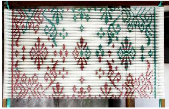
Gambar 43: Proses Pemempenan pada Alat Pemdangan Untuk Memudahkan Penggambaran Motif Kain.