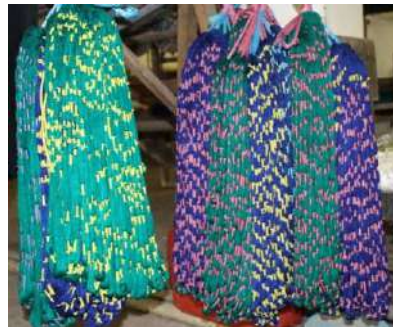
Gambar 26: Benang Pakan yang sudah diikat di Pertenunan Putri Bali