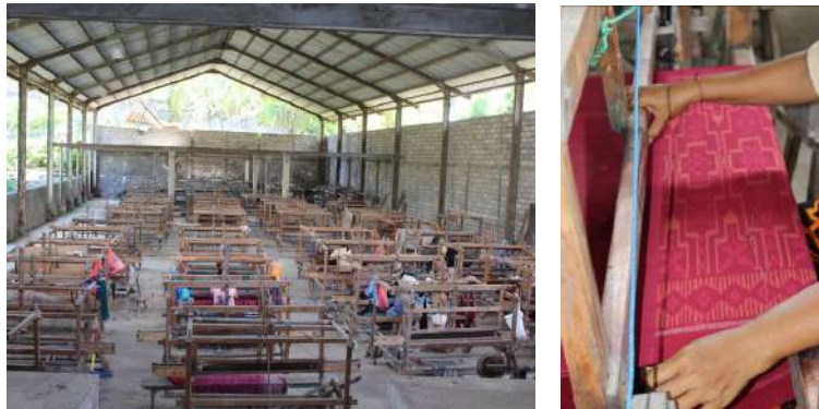
Gambar 53: Alat Tenun ATBM dan Teknik Menenun Cap Togog

Dalam buku Teknologi Pertenunan karangan Liek Soeparli dkk, dijelaskan bahwa terjadinya anyaman pada tenunan karena terjadinya silangan antara benang lusi dan benang pakan, yaitu ketika gun-gun yang membagi dua bagian benang lusi sebagian dinaikkan dan sebagian diturunkan sedemikianrupa sehingga terbentuklah rongga/sudut dan lewat sudut inilah benang pakan yang digulung pada paletan yang disimpan dalam teropong diluncurkan sambil diulur dan ditinggalkan dalam rongga/sudut tadi. Kalau pekerjaan ini diulangi dengan berganti kedudukan, sambil benang pakan yang ditinggalkan tadi dirapatkan keujung kain maka terjadilah anyaman/tenunan (1973: 13).