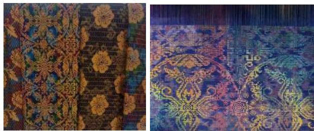
Gambar 50: Kain Arnis Motif Kain Tiga Dimensi Karya Pertenunan Putri Ayu