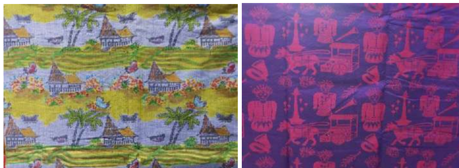
Gambar 23: Motif Hias Figuratif Rmumah Toraja Ceritera Rakyat Betawi Karya Pertenenan Putri Ayu

Motif hias dekoratif adalah suatu motif hias yang dihasilkan dari penggabungan beberapa motif hias yang berfungsi untuk menghias suatu ruang atau bidang. Motif dekoratif dibuat secara naratif dengan menggabungkan motif hias antropomorfis dengan motif flora. Motif dekoratif yang naratif ini mengangkat tokoh-tokoh yang ada dalam dunia ceritera rakyat. Ceritera tersebut dapat memberi tuntunan moral, etika dan pembentukan karakter yang sangat relevan dengan tiga karangka ajaran agama Hindu Dharma yaitu Tatwa , Susila dan upacara .