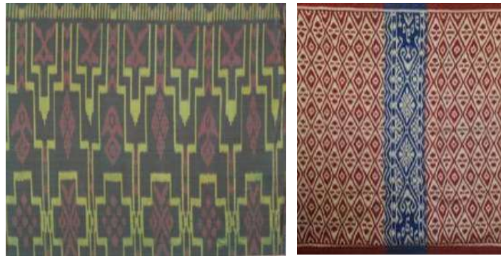
Gambar 13: Komposisi Motif Geometris Pada Kain Tenun Cap Togog

Motif hias Geometris yang diklasifikasikan kedalam ragam hias Keketusan dibuat dengan menyusun pola yang sama secara berantai dan berulang-ulang untuk mendapatkan satu kesatuan bentuk yang harmonis .