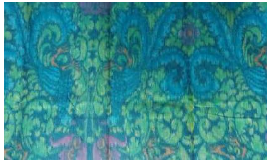
Gambar 16: Motif Hias Patra Ulanda Simetris Vertical Dan Horisontal Karya Pertenunan Putri Ayu

Patra Ulanda adalah patra yang mendapat pengaruh dari Belanda. Patra ini mempunyai ukuran pola dan unsur-unsur motif yang lebih besar dibandingkan jenis patra lainnya, sehingga nampak lebih beloh (tidak rumit). Patra ini terdiri dari unsur daun, tangkai, kepitan , util besar/kecil dan bentuk bunga yang bulat.. Patra ulanda terdiri dari daun susun/biasa (tunggal), kepitan dan ujung util yang besar biasanya digayam untuk menetralsir kesan besar.