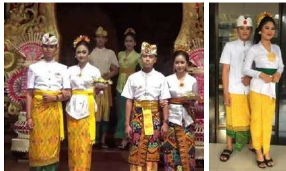
Gambar 9: Kain Tenun Dijadikan Materi Lomba Busana ke Pura

Pesta Kesenian Bali (PKB) adalah sebuah event tampilnya segala hasil kesenian Bali, baik seni pertunjukan maupun seni rupa. PKB adalah sebuah ajang tahunan kesenian Bali untuk menunjukkan hasil karyanya dari tradisi, modern, dan kontemporer. Pameran seni kerajinan Bali dengan segala produksi ditampilkan dalam ajang PKB. Berbagai macam dan jenis seni kerajinan mencul dengan tampilan yang berbeda dan variatif. Tenun merupakan salah satu seni kerajinan yang tampil dalam pameran PKB dengan segala produksinya. Semua jenis tenun yang ada di Bali dipamerkan dengan segala identitasnya. Semua kabupaten di Bali memiliki sentra kerajinan tenun dengan hasil karyanya yang unik dan artistik. Masyarakat Bali akan dapat melihat berbagai hasil karya tenun yang ada di Bali dan dapat memilih sesuai dengan yang kehendaki. Selain pameran tenun juga sering dijadikan materi lomba busana tradisional yaitu busana ke Pura yang benar, rapi, dan sopan. Banyak muda-mudi berpasangan mengikuti lomba ini untuk ikut melestarikan seni tradisi yang ada.