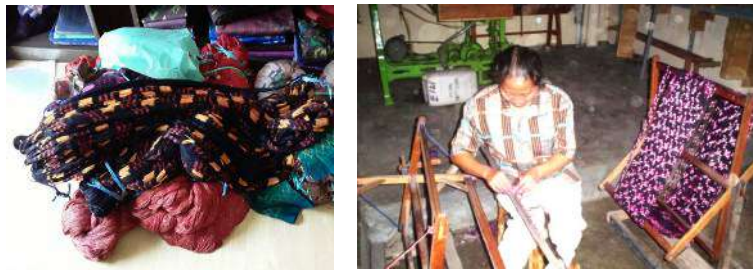
Gambar 47: Proses Pemalpalan /Memisahkan Benang