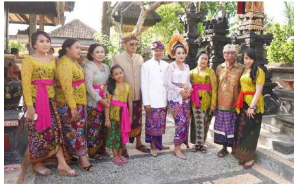
Gambar 7: Kegunaan Kain Tenun Dalam Acara Pernikahan Adat Bali

Wacana Ajeg Bali memunculkan kreasi bagi masyarakat Bali untuk berinovatif mengkombinasikan tradisi yang ada dengan gaya baru, sehingga lahir seni tradisi baru di masyarakat. Keberhasilan masyarakat Bali untuk meramu antara tradisi dan modern menghasilkan seni budaya baru dan memperkaya khasanah budaya Bali yang telah ada. Wacana Ajeg Bali mendorong masyarakat Bali untuk meningkatkan melaksanakan upacara dalam usaha untuk mencari keseimbangan dan keharmonisan jagat raya. Aktivitas upacara bermunculan dimana-mana yang dilaksanakan oleh masyarakat umum, kelompok masyarakat, maupun pribadi.