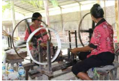
Gambar 38: Proses Pengelosan Menggunakan Rangkaian Alat Berupa Kincir, Moras Spindle , dan Kelos

moras spindle secara teratur dengan kekencangan tertentu sampai kelosan penuh dengan benang.