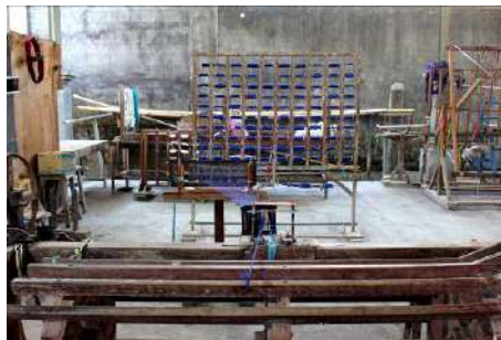
Gambar 39: Proses Penganian Menggunakan Rangkaian Alat seperti Rak Kelos , Pengantar Benang, Sisir Silang , Sisir Ani , dan Tambur Sumber: Dokumentasi Penulis, 2019