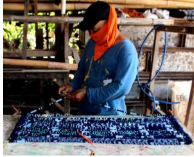
Gambar 46: Proses Pewarnaan Dengan Teknik Pencoletan atau Pencatريان