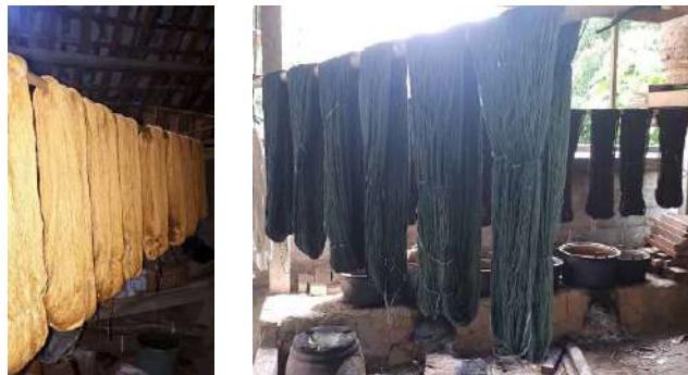
Gambar 36: Proses Pengeringan di Pertenunan Tuhu Batu