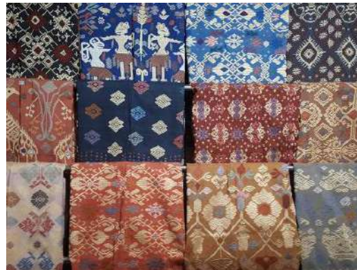
Gambar 52: Kain Songket Warna Alam Karya Pertenunan Tuhu Batu