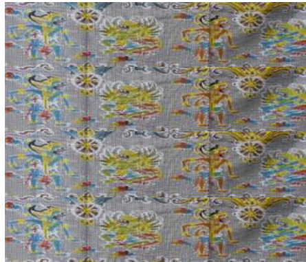
Gambar 22: Motif Hias Figuratif Tokoh Pewayangan dan Papatran pada Kain Tenun Putri Ayu

yang berbentuk pola ini visualisasinya tidak terlepas dengan teknik yang diterapkan pada pertenunan.