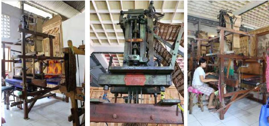
Gambar 60: Alat ATBM Jacquard dan Proses Pembuatannya

pertenunan mampu "menggabungkan" teknik menenun dengan teknik cagcag, teknik ATBM dan teknik Jacquard, sehingga menghasilkan kain yang kaya motif dan kaya teknik pengerjaannya. Motif yang timbul (motif kain gringsing) terlihat dihasilkan dengan teknik cagcag selayaknya proses membuat kain songket sedangkan sebagai dasar kain terdapat pola motif endek ikat, colet atau airbrush selayaknya kain endek hasil tenunan ATBM (wawancara, 26 November 2019).