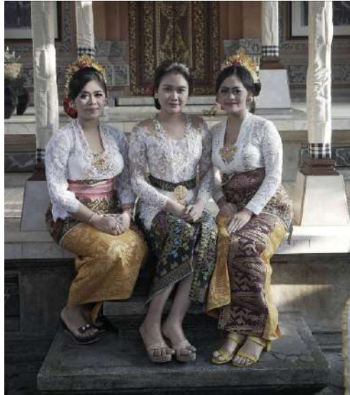
Gambar 3: Busana Sekuler Dalam Acara Ritual

Kain tenun juga digunakan pada pelaksanaan upacara adat dan agama, selain berfungsi religius, kain tenun juga berfungsi praktis sebagai busana. Tenun yang berfungsi sebagai busana juga sangat penting dan diperhitungkan oleh masyarakat pendukungnya. Masyarakat yang mau melaksanakan persembahyangan akan menggunakan busana yang baik, rapi, dan bersih untuk menghadap pada yang Kuasa. Bahkan saat ini berbusana yang bagus dan mahal seakan menjadi kekinian yang diikuti oleh semua kalangan. Hal ini menunjukkan besarnya pengaruh kain tenun terhadap alam pikiran masyarakat Gianyar terutama dalam hal berbusana. Untuk memasyarakatkan penggunaan busana Bali yang baik dan benar, sering diadakan perlombaan berbusana pada ajang-ajang tertentu. Perlombaan ini sangat bermanfaat sebagai pengetahuan berbusana yang baik dan benar dalam melakukan aktivitas budaya. Standarisasi berbusana ditentukan sesuai dengan etika, sehingga tidak ada yang berbusana kurang sopan dan menyalahi aturan. Dalam lomba berbusana, penggunaan kain tenun selalu menjadi pilihan untuk menunjukkan identitas Bali dan melestarikan budaya Bali.