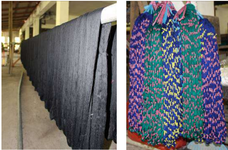
Gambar 45: Proses Pencelupan Benang Pakan dan Benang Lusi