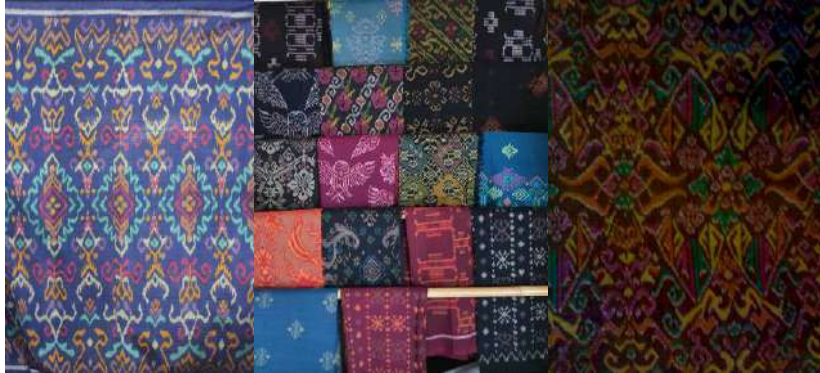
Gambar 55: Kain Tenun Endek dengan berbagai motif Karya Pertenunan Putri Bali, Tenun Ikat Wisnu Murti dan Pertenunan Sri Sedana