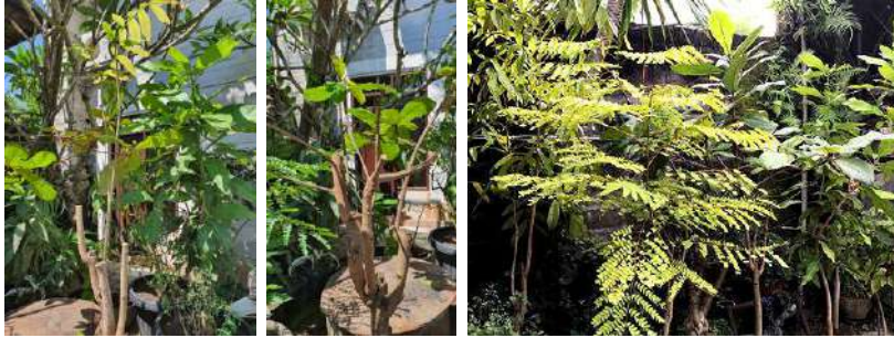
Gambar 31: Bahan baku warna alam dari tumbuh-tumbuhan di CV. Tarum Bali Sejahtera

(wawancara, 19 Oktober 2019). Mudahnya mendapatkan bahan baku warna ini, menyebabkan usaha ini terus berkembang.