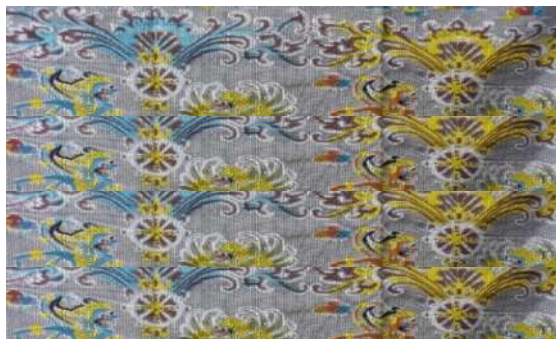
Gambar 19: Kombinasi Motif Hias Patra Punggel Pada Kain Tenun Cap Togog