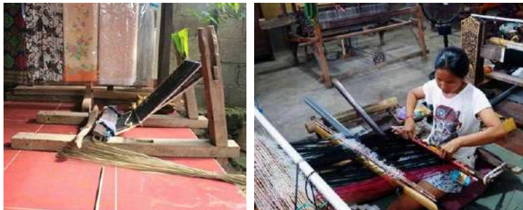
Gambar 49: Alat Tenun Cagcag dan Teknik Menenunnya

Menenun dengan menggunakan alat tenun cagcag atau gedogan/gedog tidak hanya menghasilkan sehelai kain songket yang indah tetapi juga menghasilkan kain tenun yang berkualitas tinggi karena dikerjakan dengan sangat cermat dan teliti sehingga memakan waktu yang lama. Ketelitian inilah yang menyebabkan sehelai kain tenun songket mempunyai nilai jual yang tinggi, baik ditinjau dari segi estetis, ergonomis maupun segi ekonomis terhadap pemakaiannya.