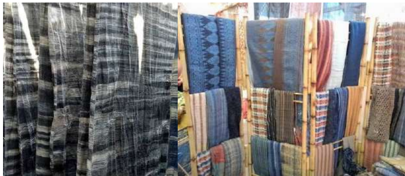
Gambar 56: Kain Tenun Karya Cv. Tarum Bali Sejahtera