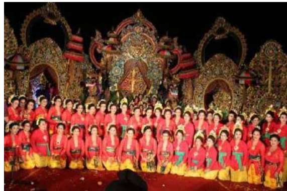
Gambar 4: Kain tenun sebagai seragam Sekehe Gong

Sejalan dengan kebutuhan masyarakat yang makin kompleks, kain tenun tidak semata memenuhi fungsi praktisnya sebagai sandang yang menutup tubuh, tetapi memiliki fungsi sosial yang lebih luas. Tidak jarang kain tenun dijadikan sarana untuk menunjukkan stratifikasi sosial di masyarakat sebagai seorang yang memiliki status sosial lebih mapan dengan orang lain. Dari kain tenun yang digunakan, masyarakat akan dapat menilai bahwa orang tersebut memiliki status sosial yang berbeda dengan yang lainnya. Kain tenun juga dapat berfungsi sebagai pengikat persaudaraan, kebersamaan, persatuan, dan kesatuan, hal ini dapat dibuktikan dengan banyaknya masyarakat yang menggunakan kain tenun sebagai pakaian seragam kelompok sekehe yang ada di masyarakat seperti sekehe gong , sekehe pesantian , sekehe kidung dan sekehe lainnya.