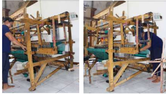
Gambar 58: Alat Tenun Dobby dan Proses Pembuatannya

Alat tenun doobby memiliki 2 macam bentuk, yakni dengan sistem kartu plat, dan sistem manual. Sistem kartu plat adalah sistem desain dengan mengisi lubang-lubang pada plat kayu/plastik dengan baut sehingga terbentuk sebuah perintah pada alat tenun untuk membentuk motif sesuai dengan keinginan. Alat tenun doobby dengan sistem kartu ini memiliki kemampuan menghasilkan bentuk desain yang lebih luas dan memiliki gun sejumlah minimal 7 buah atau lebih. Sedangkan alat tenun doobby dengan sistem manual adalah sistem desain dengan memindahkan kait-kait pada gun secara bergantian setiap langkah penenunan. Kemampuan bentuk desain pada hasil tenunan yang dihasilkan oleh sistem manual ini cenderung lebih terbatas pada bentuk-bentuk diamond, garis lurus ataupun zigzag. Alat tenun doobby dengan sistem manual ini memiliki dua buah injakan, lima gun, dan lima buah kait yang terhubung pada gun.