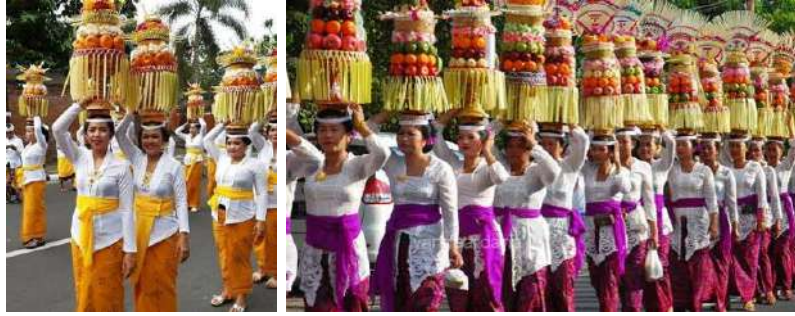
Gambar 10: Kain Tenun Dijadikan Seragam saat RangkaianUpacara Mepeed

Dalam tataran kehidupan modern yang berkaitan dengan busana sebagai fesyen, tenun tetap menjadi primadona dalam pengembangan kreativitas para perancang mode di Bali yang sudah terkenal. Banyak desainer Bali yang mengangkat kain tenun Bali, khususnya kain tenun Gianyar sebagai dasar pengembangan idenya dalam sebuah rancangan inovasi. Tenun memberikan nilai tersendiri pada fesyen sebagai sebuah karya seni tradisi yang digarap dalam ekspresi modern. Corak tenun yang sangat unik dan karakteristik memberi ruang yang sangat terbuka pada desainer untuk berkreasi menciptakan rancangan baru yang lebih spektakuler. Tenun sangat kaya akan motif, corak, dan warna merupakan elemen unik yang dapat dikreasi menjadi karya fesyen baru yang dikombinasi dengan berbagai asesoris artistik lainnya. Banyak desainer terkenal yang mengangkat tenun sebagai insirasi berkarya yang ditampilkan dalam event tertentu. Dika Saskara, dan Cok Abi adalah perancang terkenal Bali yang sering menjadikan kain tenun Gianyar sebagai bahan utama dalam rancangannya. Popy Darsono adalah desainer nasional yang pernah mengangkat tenun Gianyar dalam garapan yang eksklusif. Mereka memiliki motivasi yang besar untuk mengangkat hasil karya seni lokal menjadi sebuah garapan modern yang spektakuler.