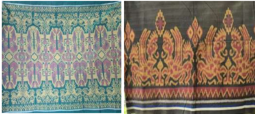
Gambar 21: Motif Singa Dan Kinara-Kinari Karya Pertenunan Putri Ayu

identitas tanda binatang muncul berupa deformasi yang bentuknya masih dapat dikenali sebagai wujud binatang.