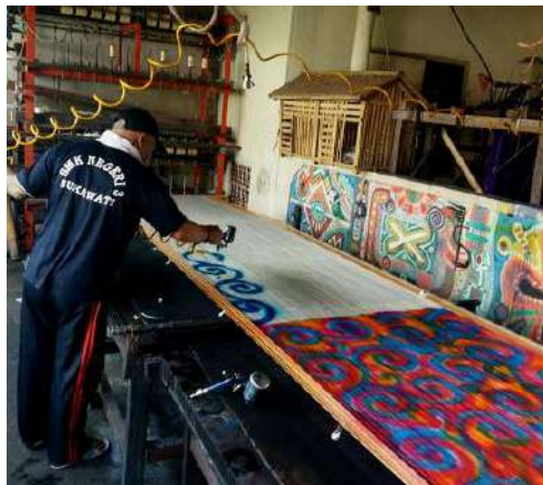
Gambar 30: Proses Pewarnaan Pada Benang Lusi dengan Teknik Airbrush Menggunakan Alat Bantu Spray Gun Untuk Menyemprotkan Warna

Lebih lanjut Adnyana mengatakan bahwa teknik pewarnaan airbrush yang dilakukan di pertenunannya adalah teknik pembuatan motif dengan menggunakan alat bantu berupa kompresor dan spray gun seperti layaknya alat untuk mengecat body mobil. Prosesnya dengan cara menyemprotkan warna membentuk suatu pola motif tertentu pada benang yang telah disusun berjejer sesuai ukuran kain yang akan dibuat. Hasil semprotan ini menghasilkan efek gradasi pada motif sesuai warna yang diterapkan. Umumnya teknik ini diterapkan pada satu bagian benang saja baik benang pakan maupun benang lusi . Jika benang pakan yang di warna airbrush maka benang lusi dibiarkan berwarna polos sesuai keinginan, dan begitu sebaliknya (wawancara, 12 Oktober 2019).