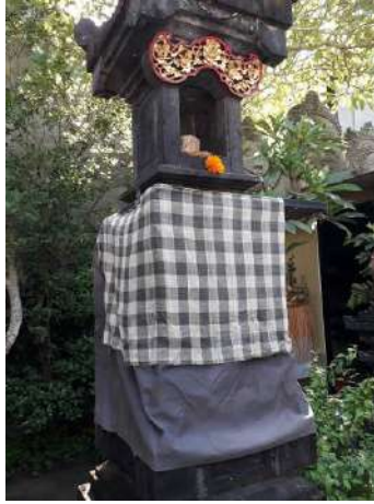
Gambar 2: Kain Tenun Wastra Poleng pada Pelinggih Tugu

Kain tenun merupakan bagian dari wastra Bali yang banyak digunakan oleh masyarakat Bali baik yang berfungsi religius maupun yang berfungsi sekuler. Di Bali, kain tenun selain dipakai untuk menutup tubuh, tetapi juga digunakan untuk menghias tempat-tempat upacara di Pura, di rumah, maupun tempat lainnya, bahkan mereka mempercayai bahwa ada kain tertentu yang berfungsi sebagai penolak bala. Jika ada seseorang yang sakit, dan sakitnya dianggap berasal dari gangguan roh jahat, maka dapat disembuhkan dengan menggunakan kain tertentu (Kartika, 2007: 81).