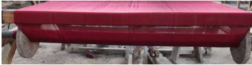
Gambar 40: Proses Pengeboman Menggunakan Alat Penganian, Alat Penggulung/ Pemutar Boom Lusi dan Boom Lusi

dibutuhkan dalam proses ini yaitu penganian, alat penggulung/ pemutar boom lusi dan boom lusi . Proses kerjanya yaitu memasang boom tenun pada posisinya kemudian ambil ujung benang pada tambur dan ikatkan ujung benang pada boom tenun. Selanjutnya memasang pengereman dan boom tenun diputar secara perlahan sampai semua benang pada tambur pindah ke boom tenun.