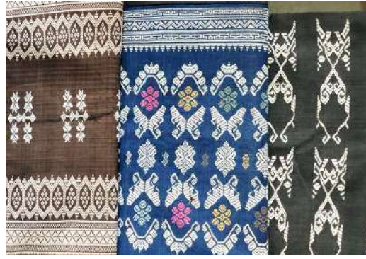
Gambar 51: Kain Songket Warna Alam Karya CV. Tarum Bali Sejahtera