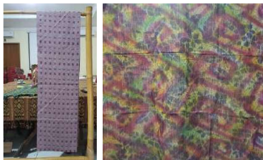
Gambar 59: Kain Dobby dengan Teknik Warna Airbrush Karya Pertenunan Putri Ayu

Alat tenun doobby memiliki 2 macam bentuk, yakni dengan sistem kartu plat, dan sistem manual. Sistem kartu plat adalah sistem desain dengan mengisi lubang-lubang pada plat kayu/plastik dengan baut sehingga terbentuk sebuah perintah pada alat tenun untuk membentuk motif sesuai dengan keinginan. Alat tenun doobby dengan sistem kartu ini memiliki kemampuan menghasilkan bentuk desain yang lebih luas dan memiliki gun sejumlah minimal 7 buah atau lebih. Sedangkan alat tenun doobby dengan sistem manual adalah sistem desain dengan memindahkan kait-kait pada gun secara bergantian setiap langkah penenunan. Kemampuan bentuk desain pada hasil tenunan yang dihasilkan oleh sistem manual ini cenderung lebih terbatas pada bentuk-bentuk diamond, garis lurus ataupun zigzag. Alat tenun doobby dengan sistem manual ini memiliki dua buah injakan, lima gun, dan lima buah kait yang terhubung pada gun.