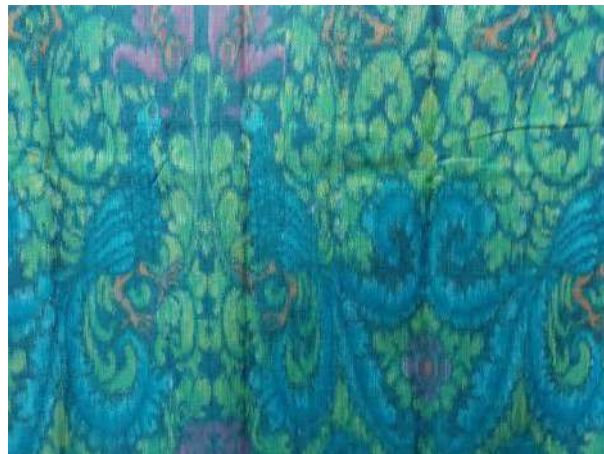
Gambar 54: Kain Tenun Endek Motif Papatran dengan Teknik Warna Airbrush Karya Pertenunan Putri Ayu