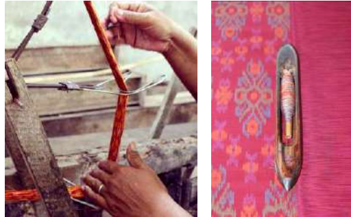
Gambar 48: Proses Pemaletan yaitu Memindahkan Benang ke Palet dan diletakkan pada Sekoci

dibutuhkan terutama ketika ada salah satu benang putus agar tidak salah dalam menyambungannya. Jika palet telah penuh terisi benang, dipindahkan ke palet berikutnya tanpa memutus benang antara palet satu dengan palet lainnya, sehingga memudahkan penenun mengingat urutan motif pada palet.