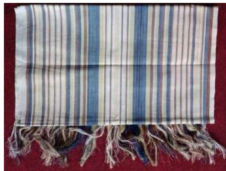
Gambar 1: Kain Be Bali karya Pertenenan Tuhu Batu

Untuk mendapatkan gambaran nyata yang lebih menyentuh pada ranah wastra sebagai hasil kegiatan seni kerajinan, maka lebih pantas membicarakannya dalam istilah “kain tenun” agar tidak menjadi bias. Kain tenun merupakan bagian yang sangat penting dalam kehidupan masyarakat Bali dan banyak dikaitkan dengan aktivitas adat dan agama.