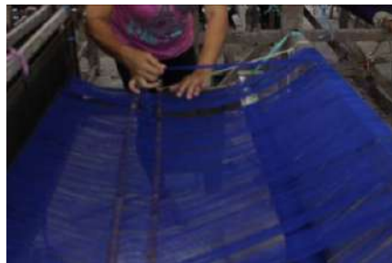
Gambar 41: Proses Pencucukan pada Guun Menggunakan Alat ATBM, Guun, Jarum Kait, Sisir Hani dan Benang dalam Boom Lusi