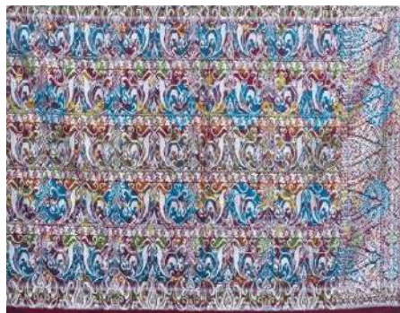
Gambar 20: Motif Hias Patra Sari Pada Kain Tenun Putri Ayu

Patra sari adalah jenis patra berbentuk bunga yang dibuat dengan menyusun patra punggel atau sebagian patra punggel secara simetris, dan di tengah-tengah dibuat bunga yang mirip dengan bentuk batu-batuan sebagai pusatnya. Simetrisnya penempatan patra punggel yang divariasikan, selain disebelah kiri dan kanan, namun juga pada bagian atas dan bawah.