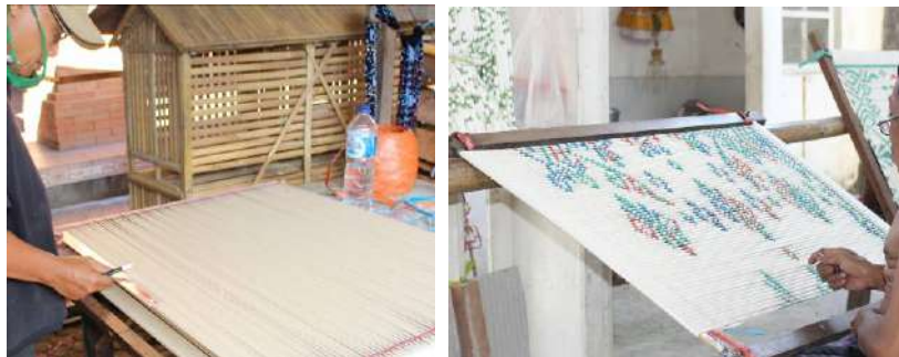
Gambar 44: Proses Menggambar Motif dan Pengikatan. Sumber: Dokumentasi Penulis, 2019