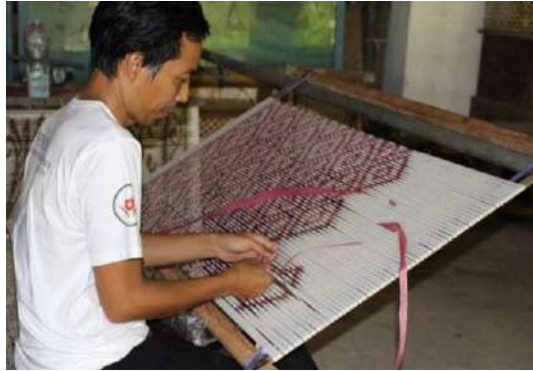
Gambar 26: Mebed Benang Pakan dalam Pembuatan Motif di Pertenunan Cap Togog