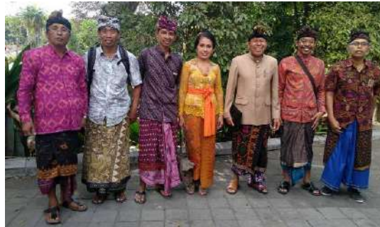
Gambar 12: Kegunaan Kain Tenun Sebagai Busana Adat Dilingkungan Akademi dan Pemerintahan Pada Setiap Hari Kamis

kerajinan tenun Gianyar untuk tetap memproduksi hasil karyanya untuk memenuhi kebutuhan busana adat Bali.. Busana adat Bali tidak saja digunakan ketika ada upacara tertentu, tetapi juga digunakan oleh sebagian masyarakat Bali setiap hari Kamis. Kebutuhan akan busana adat Bali mengalami peningkatan yang cukup tinggi karena masyarakat wajib untuk memakainya pada aktivitas tertentu. Masyarakat Bali sangat diharapkan untuk menggunakan produk lokal Bali, sehingga sasaran yang ingin dicapai dalam peraturan ini dapat tercapai.