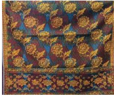
Gambar 15: Motif Hias Kembang Patra Cina Karya Pertenunan Putri Ayu