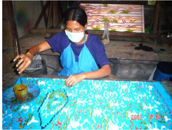
Gambar 28: Proses Pencoletan/Pencatiran Benang Pakan Untuk Membuat Warna Pada Motif

Proses selanjutnya setelah benang yang sudah dicelup warna dasar kering, kemudian ikatan benang dibuka terlebih dahulu untuk memudahkan proses pewarnaan. Tekniknya adalah memberi warna tambahan pada setiap bulih benang, untuk memunculkan warna motif yang direncanakan. Setelah semua terisi warna, benang kemudian di jemur sampai kering.