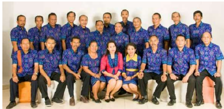
Gambar 6: Kain Tenun Sebagai Seragam PNS Sumber: Dokumentasi Penulis, 2019

Belakangan ini kain tenun banyak digunakan sebagai pakaian seragam oleh kelompok masyarakat tertentu, juga oleh instansi pemerintahan dan swasta. Setiap instansi pemerintahan sekarang telah memiliki kostim tersendiri dengan corak tenun yang berbeda. Tidak jarang bidang-bidang tertentu dalam satu instansi juga memiliki pakaian seragam tenun. Selain untuk menunjukkan kekompakan dalam suatu instansi, pembuatan seragam juga bertujuan untuk melestarikan kain tenun yang merupakan kain khas Gianyar. Belakangan ini keluarga kecil juga banyak membuat seragam tenun untuk kegiatan tertentu, seperti wisuda anak maupun acara pernikahan.