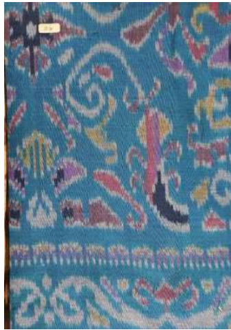
Gambar 17: Motif Hias Patra Samblung Pada Hiasan Pinggir Kain Tenun Cap Togog

Patra samblung mempunyai unsur motif yang paling sedikit dan sederhana. Patra samblung dibuat dengan menyusun unsur motif kepitan secara berulang-ulang tanpa adanya motif penyela kecuali pada susunan terakhir diberi unsur util . Patra Samblung diangkat dari pohon yang melilit pada pohon lainnya, daunnya agak besar dan banyak memiliki sulur.