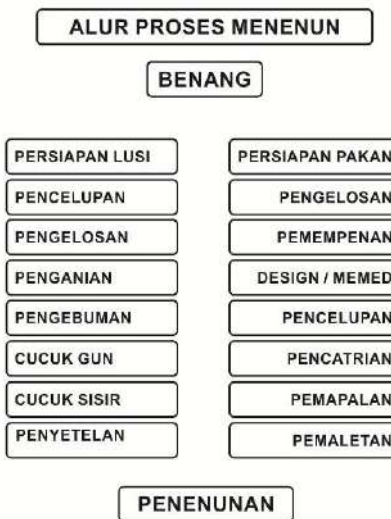
Gambar 37: Proses Pembuatan Kain Endek / Tenun Ikat

Dalam prosesnya, penciptaan selembur kain tenun baik kain tenun endek maupun kain tenun songket, umumnya melalui rangkaian proses yang cukup panjang baik pertenunan dengan pewarna sintetis/kimia maupun pewarna alami. Rangkaian proses ini dilalui dari persiapan benang lusi , persiapan benang pakan, proses pewarnaan sampai tahap penenunan. Masing-masing proses tersebut melalui beberapa tahapan seperti yang terlihat pada diagram di bawah ini.