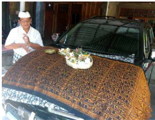
Gambar 13: Penggunaan Kain Tenun dalam Acara Upakara Tumpek Landep

Selain menjadi sarana utama dalam upacara tertentu, kain tenun juga digunakan untuk menghias simbol-simbol suci dalam suatu perangkat upacara. Kain tenun atau sering disebut dengan wastra , kerap digunakan untuk menghias tempat suci. Sebelum pelaksanaan upacara, semua perangkat yang ada dalam tempat suci akan dihiasi dengan warna-warni kain wastra . Fungsi wastra ini adalah untuk menutup bagian tertentu dari bangunan tempat suci tersebut. Dalam hal ini fungsi wastra , selain untuk menambah keindahan secara umum, agar tempat suci memiliki karakteristik religius. Pemakaian wastra ini juga menunjukkan keseimbangan dan keharmonisan semua tempat suci yang ada dalam satu areal pemujaan.