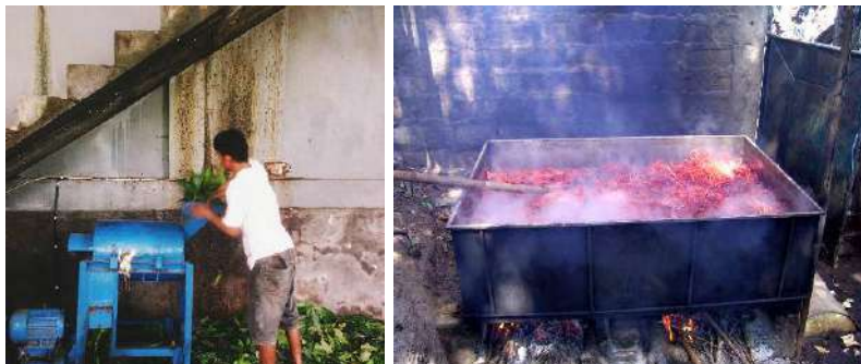
Gambar 32: Proses Perajangan dan Perebusan Bahan Warna Alam

Proses pengolahannya diawali dengan mencacah atau merajang daun-daun yang telah dipisahkan dari rantingnya menjadi ukuran lebih kecil, kemudian dijemur di bawah sinar matahari sampai benar-benar kering. Daun yang sudah kering kemudian dicampur dengan air, dan direbus \pm 5 (lima) jam.