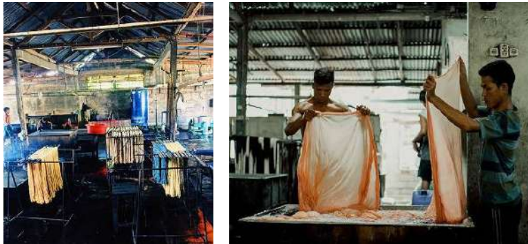
Gambar 33: Proses Pencelupan Bahan Warna Alam di CV. Tarum Bali Sejahtera

Proses selanjutnya adalah mengunci warna agar tidak mudah luntur dengan cara difiksasi menggunakan bahan penguat seperti tunjung, kapur dan tawas. Kemudian benang atau kain dasar dicuci dengan cara dikucek-kucek menggunakan tangan, ditiriskan agar kadar airnya berkurang dan proses terakhir dikeringkan menggunakan mesin pengering serta dianginkan dengan cara di jemur pada tiang gawang yang telah disediakan. Setelah semua rangkaian proses tersebut dilalui, maka bahan benang dan kain dasar sudah siap digunakan baik membuat kain tenun endek, songket, pakaian jadi dan karya-karya art deco .