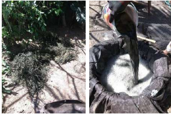
Gambar 35: Proses Pembuatan Warna Alam di Pertenunan Tuhu Batu