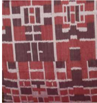
Gambar 24: Motif Hias Abstrak Karya Pertenunan Cap Togog Sumber: Dokumentasi Penulis, 2019

Motif hias abstrak adalah motif hias yang yang dibuat secara bebas, tidak terikat dengan bentuk. Motif hias abstrak merupakan ekspresi dari penenun sendiri untuk menciptakan disain yang baru. Motif abstrak terkadang merupakan hasil eksperimen dari desainer tenun untuk mencari hal yang baru. Eksperimen ini tidak saja pada motif, tetapi juga pada warna.