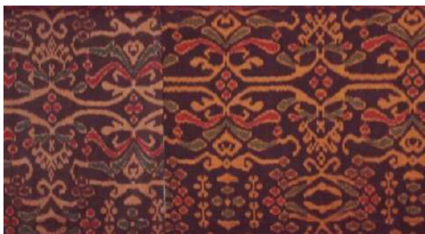
Gambar 18: Kombinasi Motif Hias Papatran Dan Geometris Pada Kain Tenun Cap Togog

Motif pepatran biasanya ditandai dengan pola garis berbentuk lingkaran, setengah lingkaran atau berlekuk kekiri maupun kekanan. Pola garis melingkar ataupun berlekak-lekuk yang dijadikan ciri sebuah pepatran tidak sepenuhnya dapat divisualisasikan secara utuh ketika diterapkan pada motif kain tenun. Perpaduan dua motif patra yang tangkainya lurus jika digabung secara simetris akan menghasilkan motif baru dalam bentuk persegi seperti motif wajik . Motif wajik bentuk baru jika diisi lagi dengan motif yang ukurannya lebih kecil tetapi warnanya mencolok dapat menghasilkan satu kesatuan motif yang sangat dinamis. Motif hias ini jarang diterapkan secara utuh pada kain tenun secara utuh.