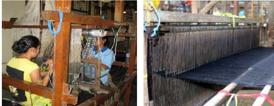
Gambar 42: Pencucukan pada Sisir Berfungsi Untuk Mengatur Jumlah Benang Sesuai Ketebalan Kain.

Begitu juga dalam pembuatan benang pakan. Terdapat beberapa alur proses sehingga benang benar-benar siap dipakai dalam menenun diantaranya; proses pemempenan, teknik desain, teknik ikat, pencelupan, pencoletan, pemalpalan dan pemaletan.