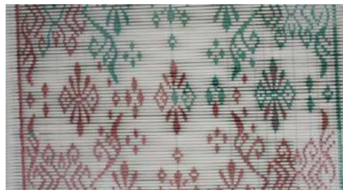
Gambar 25: Teknik Pembuatan Motif Pada Kain Tenun Pertenunan Putri Bali

Dalam setiap perusahaan tenun memiliki tenaga khusus untuk membuat motif yang mengikat benang. Tenaga khusus ini biasanya hanya membuat motif yang telah ada dan sangat jarang memiliki kreasi untuk menciptakan model yang baru. Pengembangan motif baru biasanya dilakukan oleh tenaga desainer dibawah arahan pemilik usaha. Desainer ini tidak saja kreatif dalam membuat motif baru, tetapi juga memiliki keahlian matematik untuk menghitung jumlah benang dan lobang yang tepat untuk menentukan motif tersebut sesuai dengan desain yang diciptakan. Desainer juga harus memikirkan dengan teknik tenun apa motif tersebut akan diterapkan, karena masing-masing jenis tenun memiliki teknik yang berbeda. Komposisi gerak sebagai salah satu ciri kehidupan tokoh atau figur dalam kain tenun dibuat pada bulian sesuai ukuran panjang dan lebar kain.