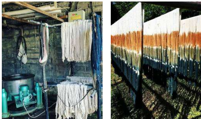
Gambar 34: Proses Pengeringan di CV. Tarum Bali Sejahtera Sumber: Dokumentasi Penulis, 2019