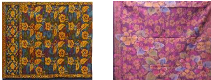
Gambar 14: Motif Hias Bunga Pucuk Karya Pertenunan Putri Ayu

Motif Hias Flora diangkat dari bagian tertentu dari bentuk tumbuh-tumbuhan yang ada di darat maupun di laut. Motif hias flora sering disebut dengan pepatran , merupakan hasil stilisasi dari tumbuhan yang hidup merambat, yang menghasilkan buah, bunga dan daun. Salah satu pepatran adalah Patra Cina dengan pola batang merambat, bunga bundar diapit tiga helai daun (Tim Penyempurnaan, 1989/1990: 504-505). Selain patra Cina dan Patra Punggel, di Bali juga dikenal patra samblung , patra ertali , patra banci , dan patra sari .