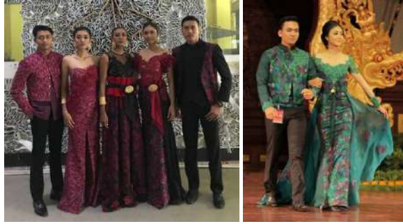
Gambar 11: Kegunaan Kain Tenun Sebagai Bahan Fashion

Belakangan ini, tenun Gianyar banyak digunakan untuk mendukung kebutuhan perabotan rumah tangga seperti tas, dompet, sandal, sarung bantal, bedkaver, korden, pembungkus jok kursi, jok mobil, dan yang lainnya. Tenun menjadi pilihan untuk pembuatan berbagai produk rumah tangga karena tenun secara visual memiliki identitas sendiri sebagai hasil karya seni budaya yang sangat unik. Dalam hal ini banyak tenun digunakan dikombinasi dengan material lainnya, sehingga kelihatan sangat indah dan menarik. Selain itu produk yang dibuat merupakan pemanfaatan kain perca yang sangat sayang untuk dibuang. Dalam hal ini perhargaan pada kain tenun sangat tinggi yaitu dengan memberi nilai lebih pada kain sisa yang tidak berguna. Banyak juga tenun Gianyar dijadikan material utama dalam penciptaan produk untuk kebutuhan perabotan rumah tangga terutama bagi masyarakat yang ekonominya menengah ke atas. Mereka sangat panatik agar segala perabotan yang digunakan dari bahan tenun Gianyar. Dalam penataan desain baru, tenun Gianyar juga banyak difungsikan untuk mendukung kebutuhan interior dan eksterior.