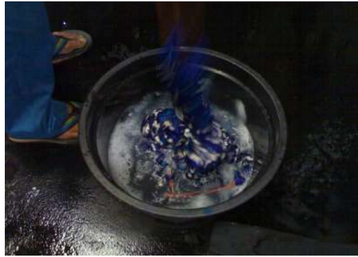
Gambar 29: Proses Fiksasi (penguncian) warna pada Benang

Lebih lanjut Adnyana mengatakan bahwa teknik pewarnaan airbrush yang dilakukan di pertenunannya adalah teknik pembuatan motif dengan menggunakan alat bantu berupa kompresor dan spray gun seperti layaknya alat untuk mengecat body mobil. Prosesnya dengan cara menyemprotkan warna membentuk suatu pola motif tertentu pada benang yang telah disusun berjejer sesuai ukuran kain yang akan dibuat. Hasil semprotan ini menghasilkan efek gradasi pada motif sesuai warna yang diterapkan. Umumnya teknik ini diterapkan pada satu bagian benang saja baik benang pakan maupun benang lusi . Jika benang pakan yang di warna airbrush maka benang lusi dibiarkan berwarna polos sesuai keinginan, dan begitu sebaliknya (wawancara, 12 Oktober 2019).