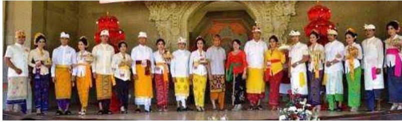
Gambar 5: Kegunaan Kain Tenun Pada Kegiatan Sosial Keagamaan

yang dikenakan oleh para delegasi. Uraian di atas menunjukkan betapa tingginya posisi kain tenun apabila disandingkan dengan kain-kain yang lainnya. Selain kualitasnya sangat baik, tenun juga memiliki karakteristik yang sangat khas dan berbobot.